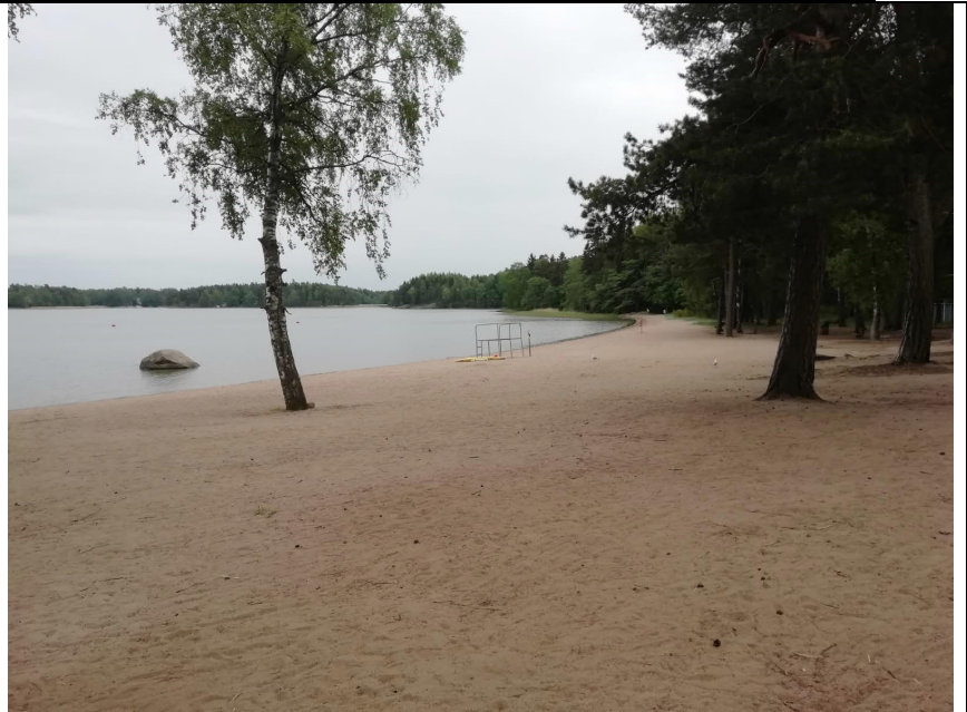
Laajasalon uimaranta kesällä 2020