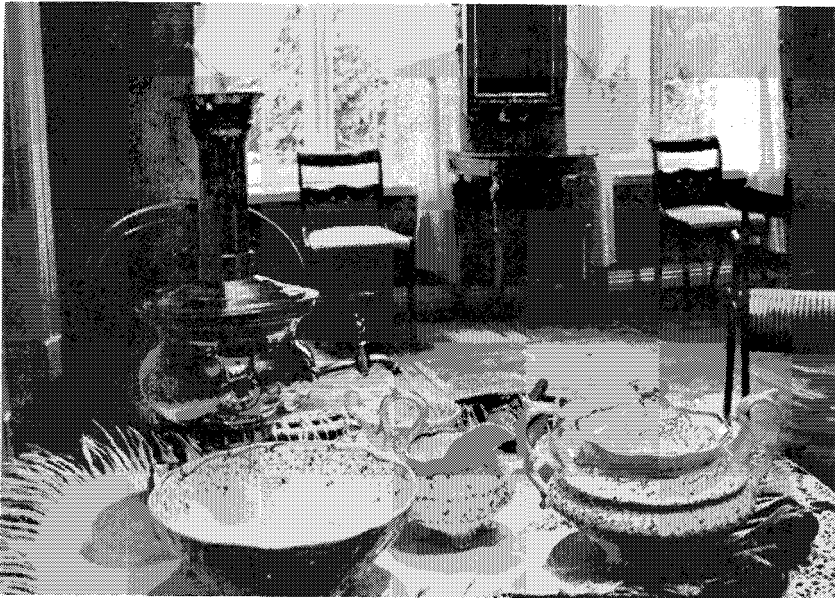
Kaupunginmuseon uusi pysyväisnäyttely. Makuuhuoneen nurkkaus 1850-luvulta. Stadsmuseets förnyade permanenta utställning. En del av ett sovrum från 1850-talet. 1974