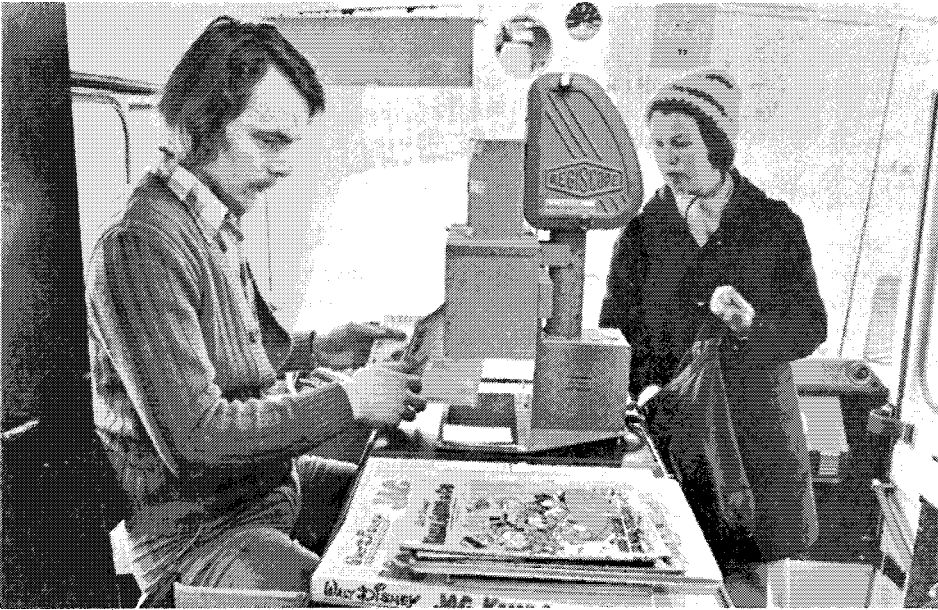
Kirjastoautoissa lainaus sujuu nopeasti autonkuljettajan suorittaessa lainojen rekisteröinnin kameralla.