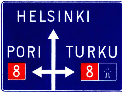
III B e 1

Yksinkertaistettu suunnistustaulu asutuskeskusten ulkopuolella