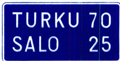
III B h