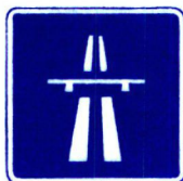
III Bi 1