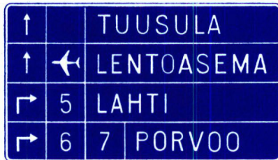
III B e 3

Yksinkertaistettu suunnistustaulu asutuskeskuksissa