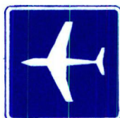
III Bi 3