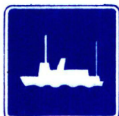
III Bi 2