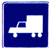
III Bi 4