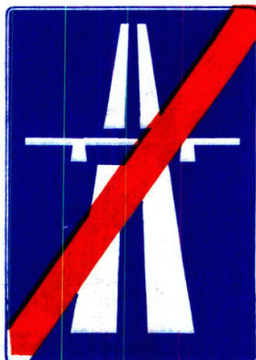
III A l