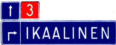
III B e 2

Yksinkertaistettu suunnistustaulu asutuskeskusten ulkopuolella