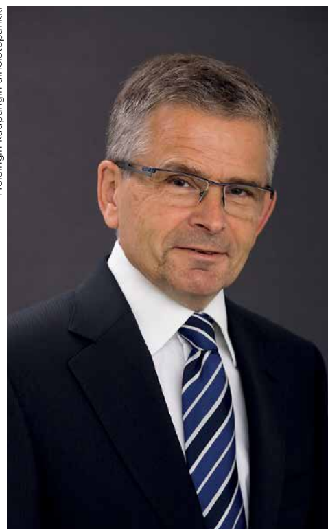
Helsingin kaupungin aineistopankki