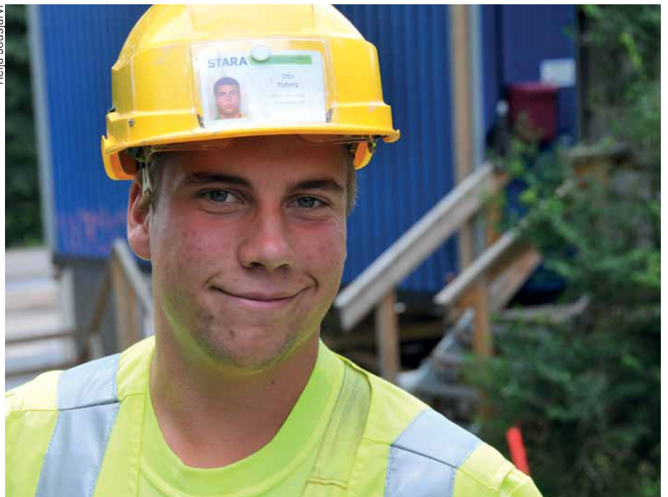
Kaupungin palveluksessa oli vuoden 2012 lopussa 40 129 henkilöä, joka on 1,75 prosenttia enemmän kuin edellisen vuoden lopussa.

henkilöä vuonna 2011) ja siirtyi eläkkeelle 675 henkilöä (825). Eläkkeelle siirtyneiden keski-ikä oli 63,1 vuotta (62,9). Vakinaisen henkilöstön keski-ikä oli 46,5 vuotta, sama kuin vuonna 2011. Määräaikaista henkilöstöä oli 6 735 (6 637 vuonna 2011). Määräai-