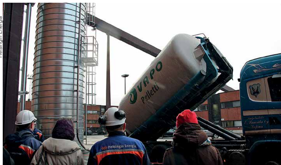
Helsingin Energia aloitti kehitysohjelmansa mukaisesti puupellettien koepolton Hanasaaren voimalaitoksella vuonna 2012. Koepoltoa varten Hanasaaren voimalaitosalueelle rakennettiin 26 metriä korkea siilo, josta pelletit syötetään polttoprosessiin.

Uusimman vuonna 2012 valmistuneen meluselvityksen mukaan tie- ja katuliikenteen yli 55 desibelin melualueella asuu Helsingissä 282 060 asukasta. Raideliikenteen yli 55 desibelin melualueella asuu 73 680 asukasta ja lentoliikenteen melualueella asukkaita on 569. Melualueella asuvien määrän kasvu edelliseen selvitykseen verrattuna johtuu pääosin laskenta-asetusten ja mallinnusperiaatteiden tarkentumisesta ja osin myös asukas-