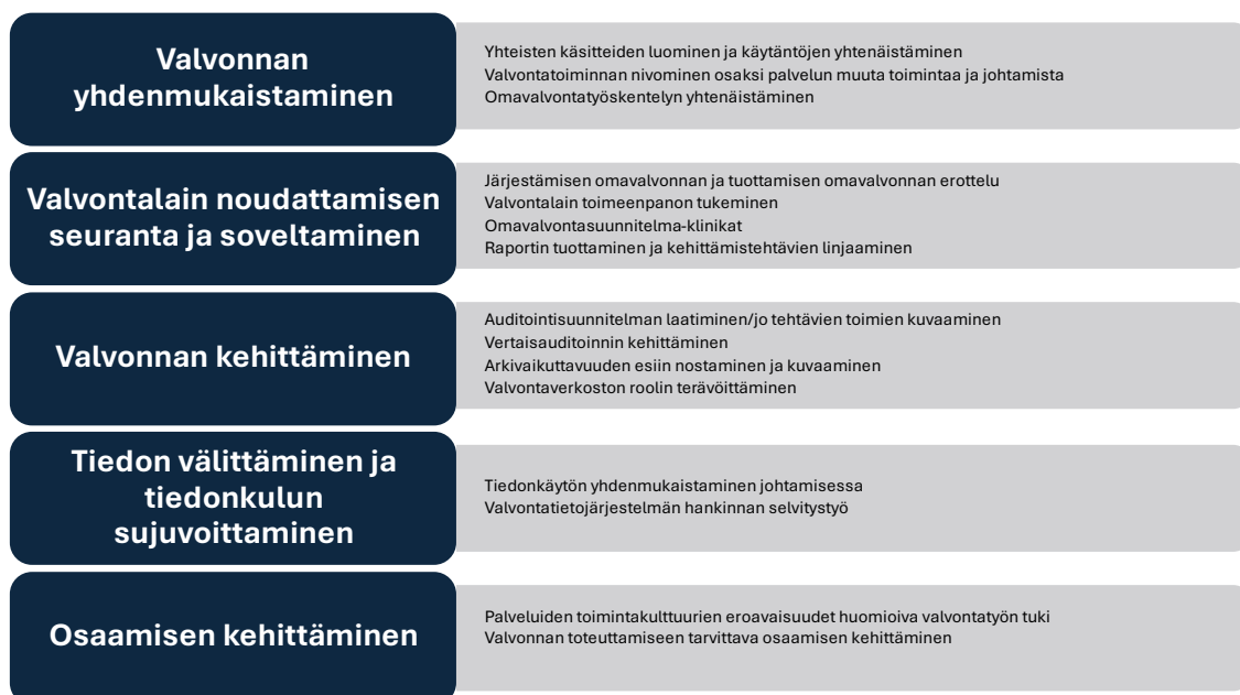
Kuvio 2. Valvontatyöryhmän työskentelyn painopisteet vuodelle 2024

Toimialamme valvontatyöryhmän keskeisiksi tehtäviksi on nostettu valvonnan yhdenmukaistaminen, valvontalain noudattamisen seuranta ja soveltaminen, valvonnan kehittäminen, tiedon välittäminen ja sujuvoittaminen sekä osaamisen kehittäminen (kuvio 7). Näiden toteutumista on tarkoitus tarkastella myös osana valvontalain edellyttämää järjestäjän ja tuottajan omavalvonnan raportoinnin onnistumista.