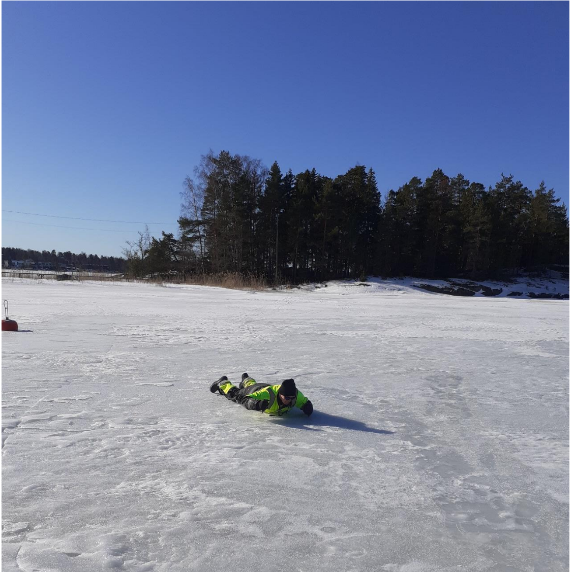
Jäistä pelastautumisen harjoittelua naskalein Stansvikissa