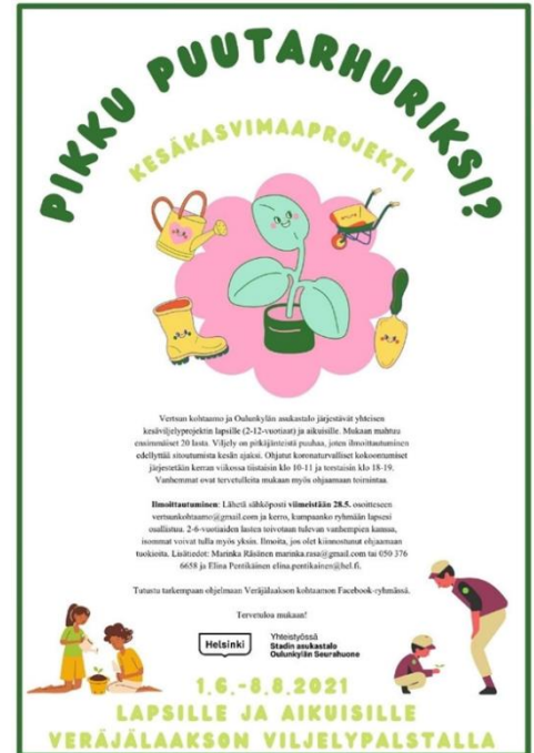
Pikku puutarhureiden mainos, jota jaettiin rappukäytäviin ja asukastalolla.

riittävä ja onnistunutta siihen nähden. Jatkoa ajatellen projektista voisi tiedottaa enemmänkin, ja toimittajia voisi kutsua mahdollisesti sadonkorjuujuhlaan tai esimerkiksi perunanistutukseen tai muuhun aktiiviseen toimintaan. Myös kolumniehdotusta tai kuulumisia palstaltajuttusarjaa voisi viritellä paikallislehteen, ja lapset voisivat itse kirjoittaa kokemastaan. Eri kulttuureista tulevien ihmisten tavoittamiseksi henkilökohtaiset kontaktit saattaisivat toimia paremmin kuin yleiset ilmoitukset. Jos kieli on ollut esteenä osallistumiselle, on jatkoa ajatellen tiedottaminen ja puutarhuritoiminnan