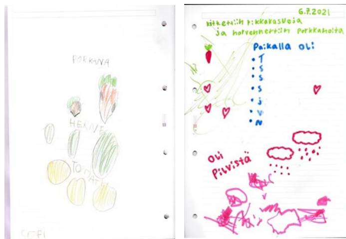
Lapset kirjoittivat puutarhapuuhiin päätteeksi päiväkirjaan mitä olivat tehneet ja saivat piirrellä päiväkirjaan.