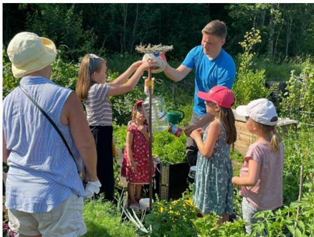
Linnunpelätin askarreltiin lasten ja aikuisten yhteistyöllä kierrätysmateriaaleista, joita kotoa löytyi.

Tiedottamisesta vastasi projektissa nimetty henkilö, mikä oli toimiva ratkaisu. Lapsilta ja vanhemmilta kerättiin kuvausluvut, mikä helpotti kuvaamista palstalla. Saadun palautteen perusteella rappukäytävälmoitukset olivat olleet kanava, josta lapset tai vanhemmat olivat huomanneet ilmoitukset parhaiten. Ryhmät täyttyivät ennen määräaika, joten tiedotus oli