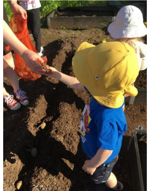
Pikku puutarhurit tositoimissa: perunan istuttaminen oli jännää ja hauskaa puuhaa.

Sekä palstalla että projektin juhlissa huomioitiin koronaturvallisuus, ja vanhempia oli ohjeistettu hygienia-asioista asiaankuuluvasti. Välipalojen valmistamisessa ja tarjoamisessa noudatettiin hyvää hygieniaa.