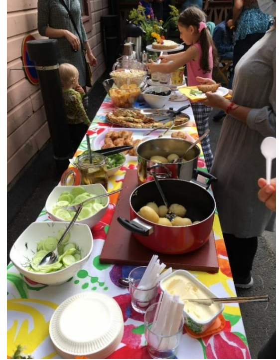
Sadonkorjuujuhlaa vietettiin kauden päätteeksi ja tarjolla oli mm. omia perunoita, kurkkuja ja herneitä.

Suurin osa palautteen antaneista lapsista haluaisi osallistua uudestaan ensi kesänä. Vanhemmista muutama haluaisi tulla mukaan ohjaamaan siitäkin huolimatta, ettei kasvitietoutta ennestään ole. Kohtaamon toiminnan kehittämisessä erilaiset tapahtumat ja perhekahvila/asukaskahvila olivat suosikit. Muutama aikuinen haluaisi myös tulla mukaan ideoimaan ja järjestämään toimintaa. Vapaa sana kiitteli vielä projektista ja ihanista ja huumorintajuisista ohjaajista ja toivottiin, että ensi kesänä nähdään taas.