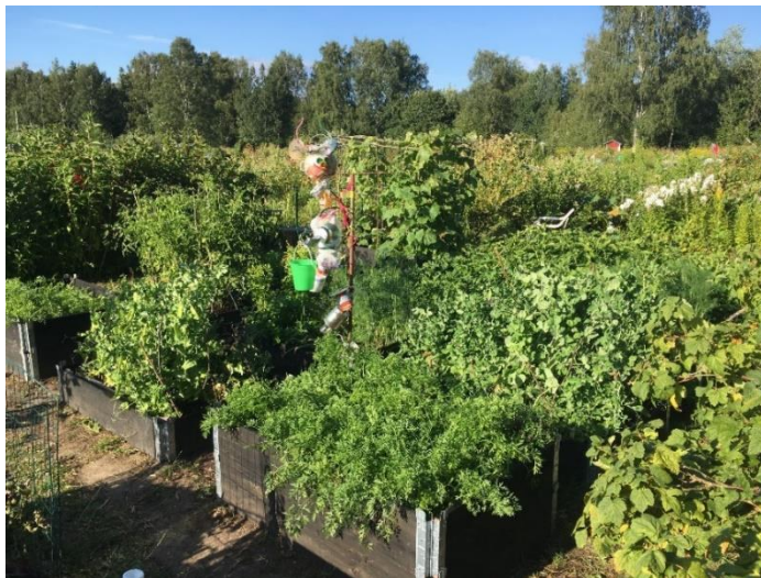
Viljelypalsta kukoistaa heinäkuun puolivälissä pienten puutarhureiden ahkeran kastelun ja Kekkilän muhevan mullan ansiosta. Kesän aikana luonto antoi avustusta vain yhden kesäsateen verran.

Sadonkorjuujuhlassa nautimme palstan sadosta ja itse leivotuista herkuista sekä yhteisestä tekemisestä kasvien tunnistuksen, perunaviestin, pantomiimin ja "kasvatetaan iloa" katuliituilun merkeissä. Vanhemmille näytettiin kuvia palstalta. Puutarhureille jaettiin lopuksi diplomit sekä porkkanat kiitokseksi hienosta työstä ja osallistumisesta!