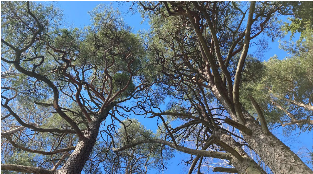
Kuva 3. läkkäitä mäntyjä Lehtisaaressa.

Tarkempia tietoja liito-oravien ja lepakoiden levinneisyydestä saa Helsingin kaupungin ympäristöpalvelujen kartoituksista kaupungin karttapalvelusta. Myös liito-oravien todennäköiset liikkumisreitit tulee ottaa huomioon.