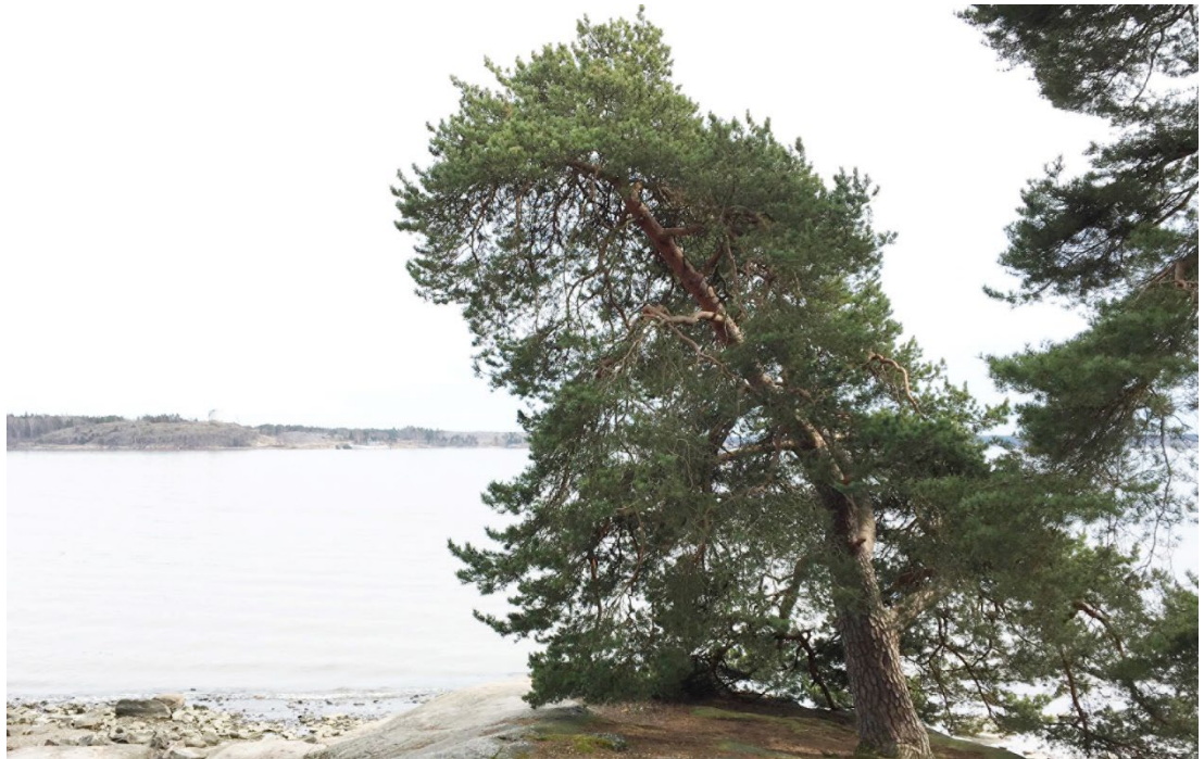
Kuva 2. Yksittäisilläkin puilla voi olla suuri merkitys maisemassa.

Epäselvissä tilanteissa hankkeen vaikutusten ja maisematyöluvan tarpeellisuuden arviointi on rakennusvalvonnan tehtävä. Rakennusvalvonta antaa pyynnöstä asiaa koskevan lausunnon (maisematyölausunto). Rakennusvalvonta voi käyttää arvioinnin apuna kaupungin puidenkatselmusryhmää.