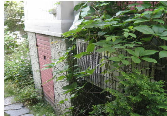
Ilmalämpöpumpun huomaamaton sijoitus ja laitteen yksinkertainen suojaus köynnösritilän avulla Tapanilassa sijaitsevan pientalon pihajulkisivun sokkelissa.