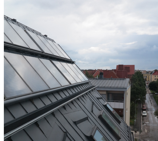
Useamman aurinkokeräimen muodostamat pinnat suunnitellaan osana kattopinnan sommittelua rakenteiden, putkitusten, johdotusten ja värien osalta.

Omakoti-, pari- ja rivitalon julkisivuun ilmalämpöpumpun tai jäähdytyslaitteen ulkoyksikön voi sijoittaa siten, että se ei näy kadulle. Kadunpuoleiselle julkisivulle ulkoyksikön voi asentaa ainoastaan maantasoon, ikkunoiden tavanomaisen alareunan tason alapuolelle siten, ettei se näy kadulle. Aurinkokeräimet tulee lähtökohtaisesti sijoittaa pihanpuoleisille katon lappeille tai piharakennusten katolle jos se on valoisuuden kannalta mahdollista.