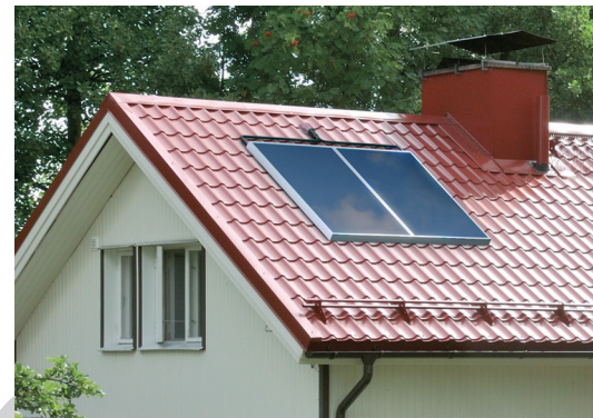
Pientalon aurinkolämpöjärjestelmään liittyvät keräinkentät on suositeltavaa sijoittaa pihanpuoleiselle katon lappeelle jos se on teknisesti hyvä ratkaisu.