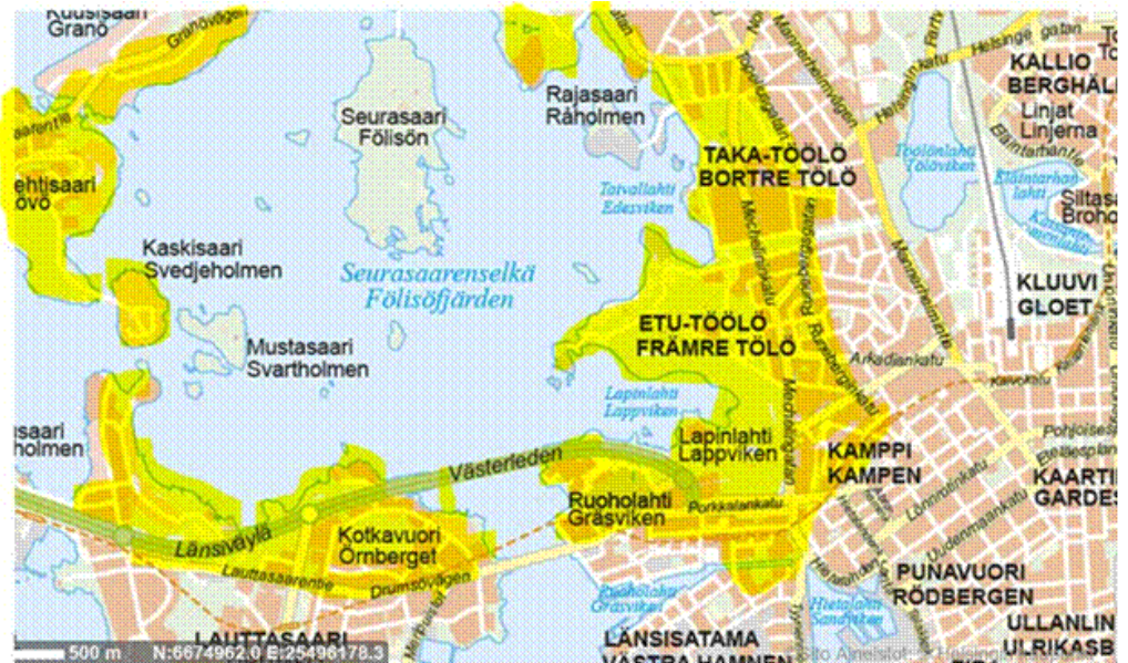
Kuva 1. Asukkaille jaettavan tiedotteen jakelualue.