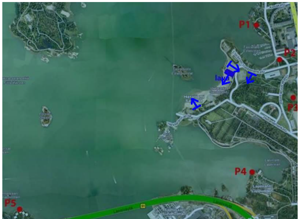
Kuva 3. Helimäki Akustikot Oy:n laatiman mittaussuunnitelman mukaiset ympäristömelumittauspisteet.

Melumittauksia tehdään Helimäki Akustikot Oy:n laatiman mittaussuunnitelman mukaan (Lausunto 5824-5a, 29.5.2018). Mittauksia tehdään kaikkien konserttien aikana. Ympäristömelumittaukset tekee Helimäki Oy. Mittauspisteet on esitetty kuvassa 3.