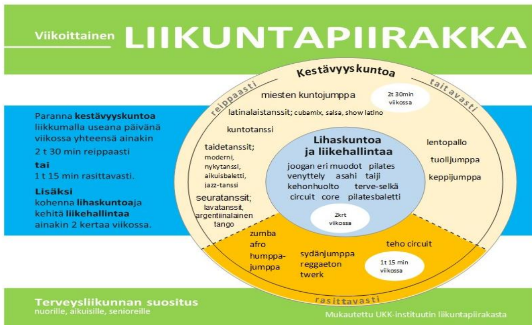
Kuva 2. Liikuntapiirakka työväenopistossa

Liikuntapiirakka kiteyttää viikoittaisen terveystieteellisen liikuntasuosituksen, jonka suosituksiin pohjautuu liikunnan tuntitarjonta sekä opetuksen ohjaus ja neuvonta.