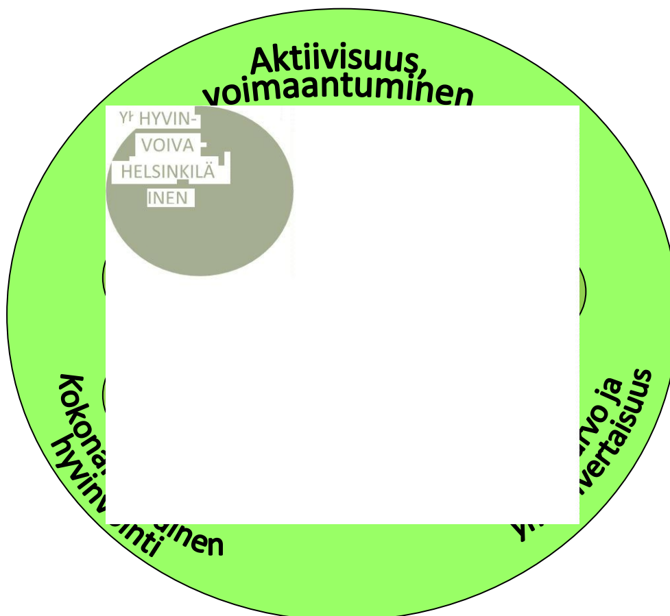
Kuva 1. Hyvinvointi- ja terveysopetuksen tavoitteet yksilö- ja yhteisötasolla

Kuviossa 1 on esitetty keskellä toisaalta opistotoiminnan kohde ja toisaalta aktiivinen, itsenäisesti toimiva kaupunkilainen. Seitsemässä ympäröivässä lehdykässä kuvataan opetuksen yksilökohtaisia tavoitteita ja taustalla kolme yhteiskunnallisesti vaikuttavaa tavoitetta.