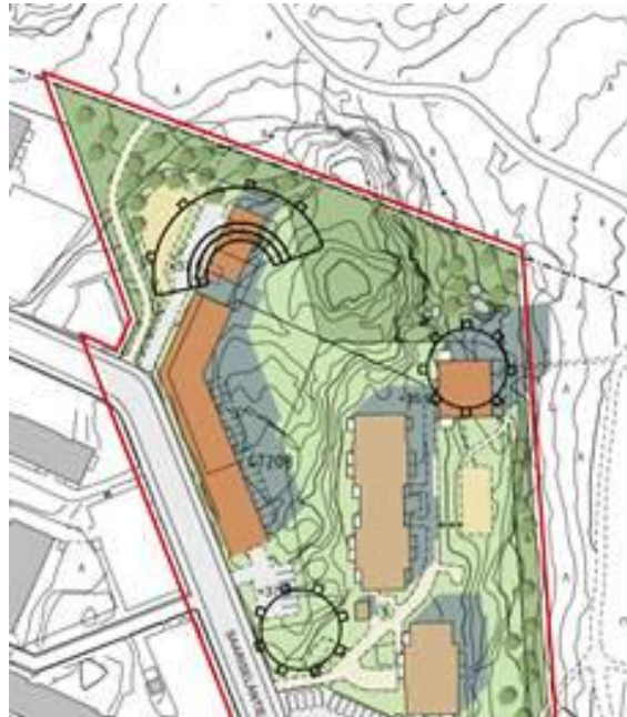
Viitesuunnitelman rakennukset sijoitettuna havainnekuvaan

9.12.2014, täydennetty 16.12.2014 ja 1.12.2015