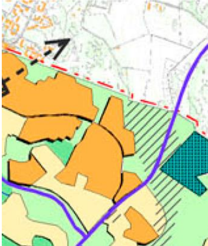
Ote yleiskaava 2002:sta

Rakennusten sijoittaminen kadun varteen on rakennetussa kaupunkiympäristössä luontevaa. Kallioiden lakialueet säilyvät rakentamattomina joko virkistysalueella tai osana tontteja.