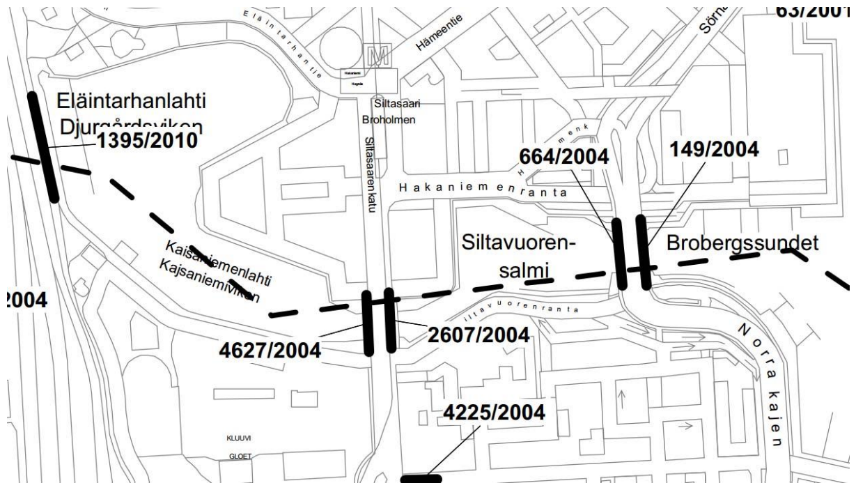
Kuva 1. Jalankulkulaskelmien tulos: jalankulkuvirrat ovat paljon voimakkaampia siltasaarenkadun länsireunalla.

länsipuolelta itään. Tämä voitaisiin toteuttaa muuttamalla Toinen linja Arenan talon kohdalla ja Hakaniemen torikatu kävelykaduiksi sekä parantamalla John Stenbergin rannan kävely olosuhteita. Mahdollisesti Pitkälle sillan rinnalle voisi myös rakentaa kävelysillan.