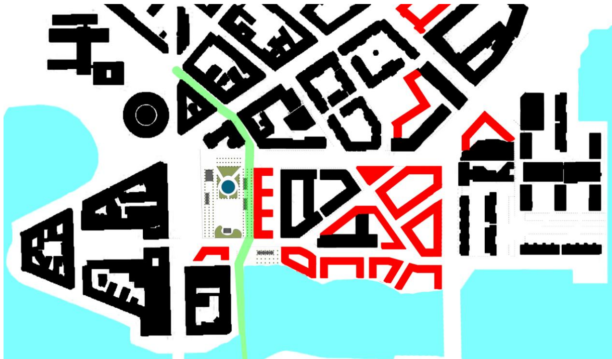
Kuva 2. Torin ja Merihaan väliin mahtuu uudisrakentamista noin 2000 - 2500 asukkaalle (punaiset rakennukset). Purku-uhan alla oleva Hakaniemen silta kannattaa rakentaa uudelleen hieman idemmäksi, jolloin nykyiselle paikalle mahtuu uudisrakennuksia. Vihreällä on piirretty jalankulkijoiden laatuikäytävä, joka alkaisi Arenan talolta ja jatkuisi torin yli John Stenbergin rantaan ja siitä uutta jalankulkusiltaa Kruunuhaan puolelle.