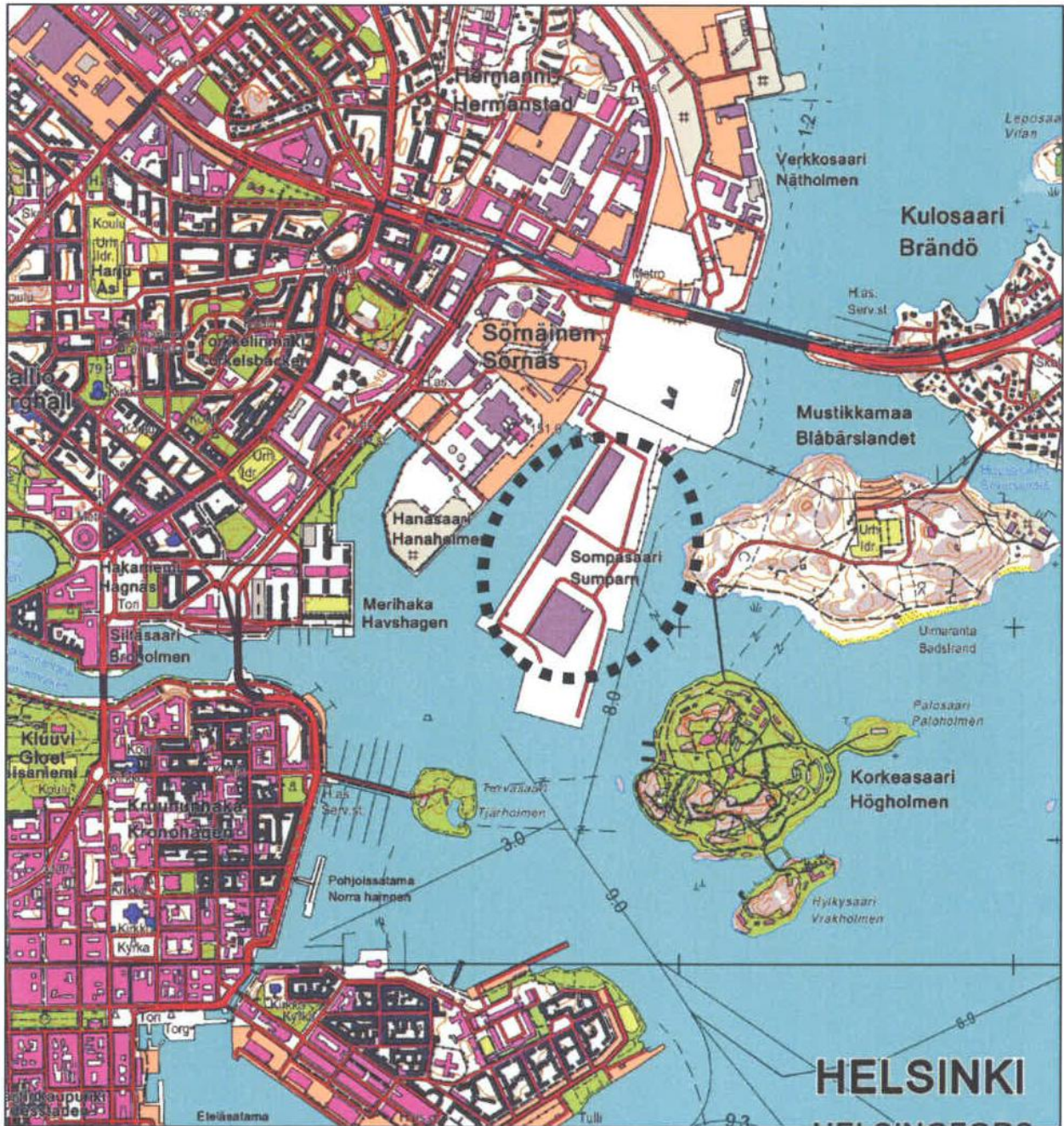
Kuva 1. Suunnittelualan sijainti (pohjakartta Maanmittauslaitoksen Maasto-tietokannan 11/2012 aineistoa).