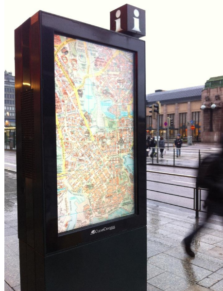
Kuva 3: Kaupunkinäyttö Kaivokadulla