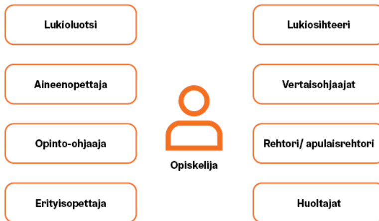
KUVA 1. Ohjauksen toimijat