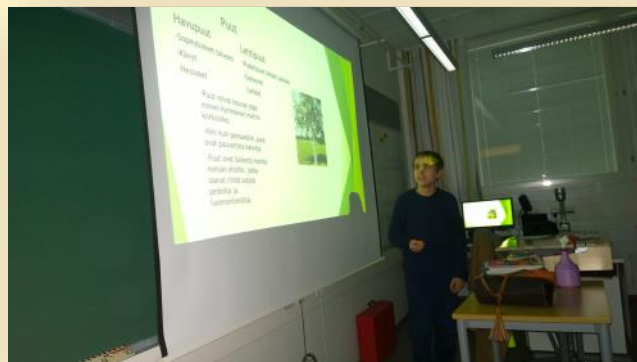
Oppilas opettaa muulle luokalle.

Tämän lukuvuoden aikana koulut tekevät yhteistyössä uudelle Vesalan yhtenäiselle peruskoululle vielä yhden uuden opetussuunnitelman, joka otetaan käyttöön syksyllä 2017. Muutoksia siis riittää ja pienin askelin muutos etenee myös käytäntöön.