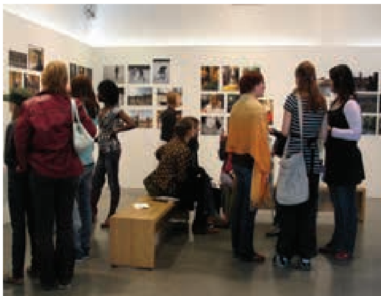
Kenen maa? –näyttelyn avajaiset

Taidemuseo on erittäin kiinnostunut yhteistyöstä ja ottaa mielellään vastaan ryhmiä nuorisotaloilta tutustumiskierrokselle ja työpajoihin.