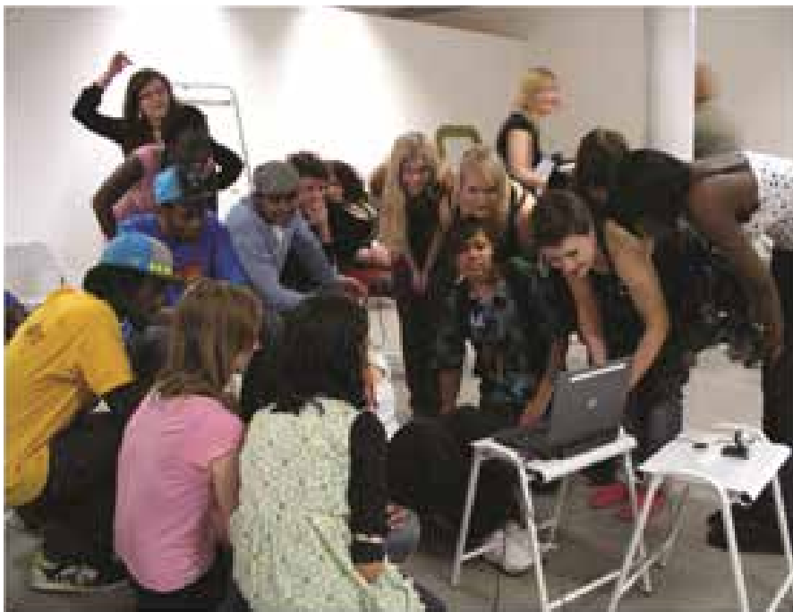
Animaatiopaja Liverpoolissa

Vantaan nuorisotoimessa visuaalista taitoa ja kädentaitoja käytetään nuorisotyön metodina avoimessa iltapäivätoiminnassa sekä Vernissassa järjestettävillä animaatiokursseilla. Yhteistyötä on tähän mennessä tehty pääkaupunkiseudun yhteistyösopimuksessa määriteltyjen tapahtumatuotantojen puitteissa, mutta Vantaalla löytyy halua myös jakaa osaamista enemmänkin helsinkiläisten kollegoiden kanssa. Vierailin vanhassa vernissan keittämiseen käytetyssä salissa, joka tarjoaa satumaisen rosoiset puitteet animaatioiden tekemiselle sekä esittämislle. Nuorten ryhmissä (11-20v) tehdään nukkeanimaatioita alkaen nukkejen valmistuksesta asti. Nuorten tekemät nukket istuskelevat ryhmänä orrella ammattilais-animaattoreiden sekä alan opiskelijoiden nukkejen rinnalla. Animaatioita pystyy tekemään myös työpaikatyyppisesti, jolloin lopputulos on lyhyempi, mutta sitäkin monimuotoisempi. Näitä animaatioelokuvia on lähetetty kansainvälisiin kilpailuihin ja ne ovat matkanneet ympäri maailmaa. Työpajamahdollisuus sopii esimerkiksi kouluista vieraillemaan tuleville nuorten ryhmille.