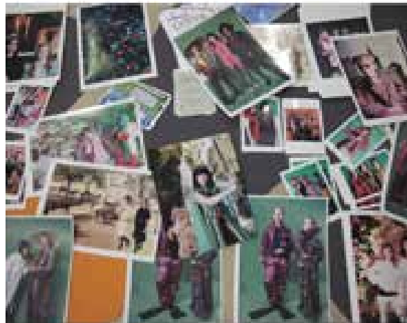
“Näe itsesi uusin silmin” – Reaktori 2010

Reaktori on koko nuorisoasiainkeskuksen yhteinen suur tapahtuma. Reaktorin ajatuksena on tarjota nuorille hiihtoloman aikana monipuolista toimintaa, jota osaltaan tuottaa myös taideosasto. Vuonna 2010 toimintaa toteutettiin visuaalisen taidon ja taiteen, ilmaisutaiteen sekä Nuorten median yhteistyönä. Osastolla nuoret saivat pukeutua roolivaatteisiin, maskeerata itsensä, otattaa valokuvia yksin tai kaveriporukassa, sekä skräpätä taustan valokuvalleen. Lisäksi osastolla oli myös paperikorujen valmistamista sekä kollaasien tekemistä. Yhteistyö koettiin erittäin onnistuneeksi, ja nuorten into oli käsin kosketeltavaa.