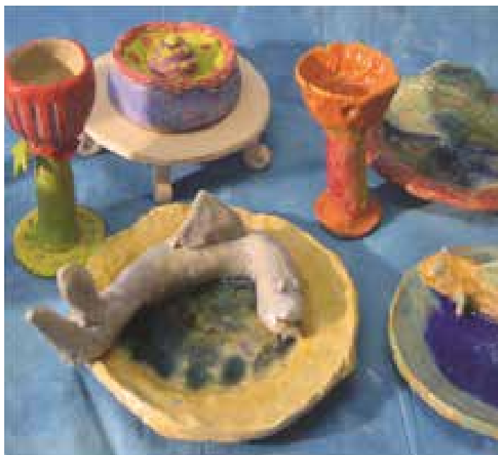
”Pöytä on katettu” –Nuori taide 2006