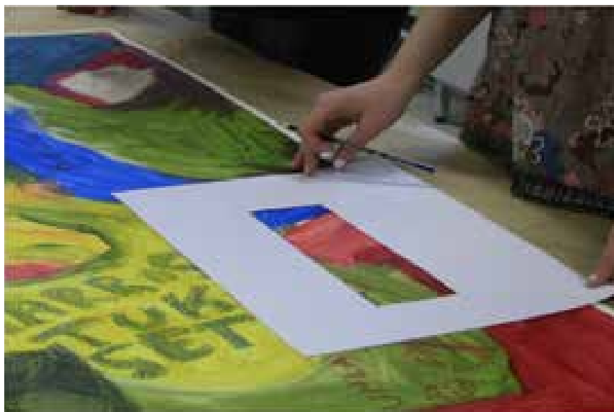
Värkkäämössä syntyivät upeat puitteet Monen Äänen Festivaalille.

Keväällä 2010 järjestettiin ensimmäistä kertaa Suomessa poikkitaiteellinen Monen äänen festivaali, jossa nuoret ja nuorten ryhmät kokosivat yhdessä musikaalinomaisen teatteriesityksen. Nuoria oli mukana 100, ja he olivat itse valinneet teemaksi sosiaalisen median: ”Astu peliin”-esitys kertoi sosiaalisen median vaikutuksesta nuorten elämään. Esityksen yhteydessä kulttuuriareena Glorian seinille oli koottu ”Silmäpeliä” –näyttely, jossa esiteltiin Vuosaaren peruskoulun kannanottavaa katutaidetta, Valtin mangaryhmän piirroksia, sekä Hapen Sankarit-ryhmän pelihahmoja. MOFEn lähtökohta on vahvasti nuorten osallisuus.