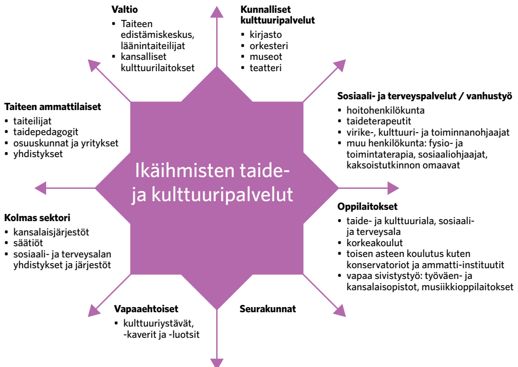
Kuvio 1 Ikäihmisten kulttuuripalveluita tuotetaan monen toimijan yhteistyönä.

Helsingissä ikäihmisten kulttuuristen oikeuksien toteutumiseen sekä taiteen ja kulttuurin saavutettavuuteen vaikuttaa useita ohjelmia, strategioita ja lakeja. Helsingin vuosille 2012–2017 laaditun kulttuuristrategian mukaan helsinkiläisen kulttuuripolitiikan tavoitteisiin kuuluu kaupunkilaisten elämänlaadun ja toimintakykyisyyden parantaminen. Tavoitteena on myös yhteisöllisyyden ja henkisen hyvinvoinnin edistäminen, syrjäytymiskehityksen ehkäisy ja monikulttuurisen kaupungin kehitys. Erikseen painotetaan kulttuuripalveluita hyvinvoinnin tuottajana. Strategiassa huomioidaan myös Helsinki kaksikielisenä kaupunkina, jossa suomenruotsalainen kulttuuri on osa kulttuurielämää. Kult-