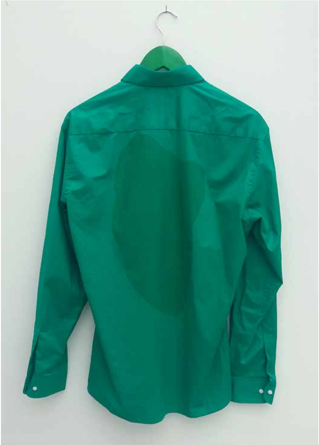
Kuva: Suomen Kulttuurirahasto myönsi vuonna 2015 kuvataiteilija Timo Tähkäselle kolmevuotisen taiteilija-apurahan työs- kentelyyn ikääntyneiden palvelukeskuksessa. Kuvassa teos "Tanssin jälkeen" (maalauk), Kangasväri paidalle, 2015.