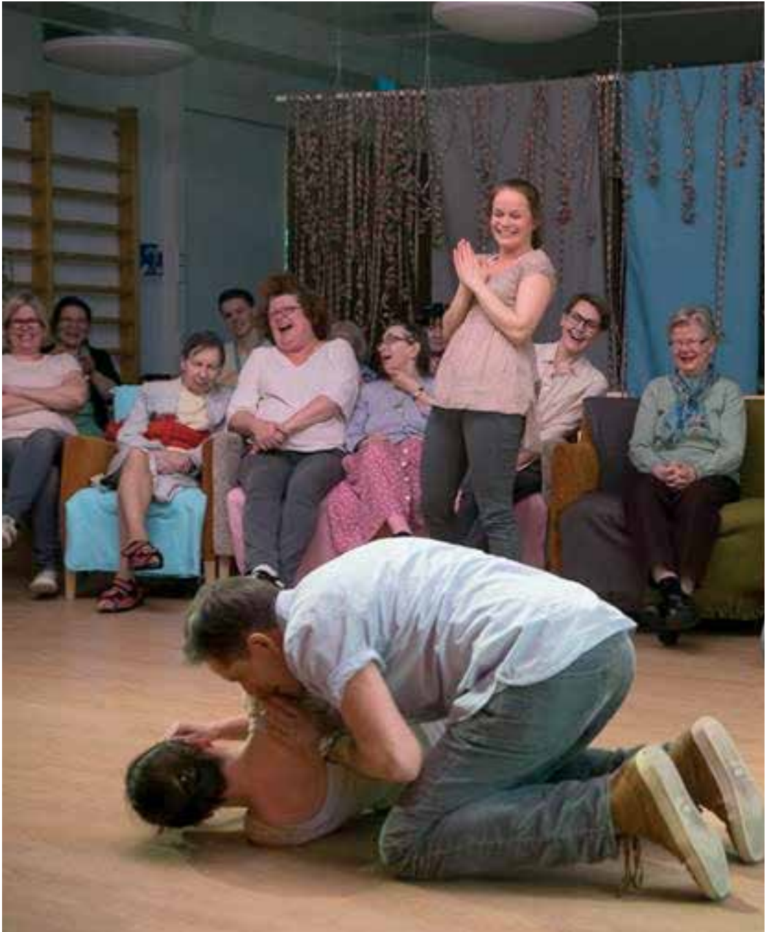
Kuva: Helsingin kulttuurikeskus myönsi vuonna 2013 Teatteri Takomolle kolmevuotisen kehittämisavustuksen Töölön monipuolisessa palvelukeskuksessa toteutettavaan vanhustyöhankkeeseen. Kuvassa Töölön monipuolisen palvelukeskuksen vapaaehtoisen teatterikerhon demo, jossa paikalla asukkaita ja heidän omaisiaan sekä Teatteri Takomon näyttelijöitä ja muita henkilökuntaa. Kuvaaja: Kai Widell, 2014.