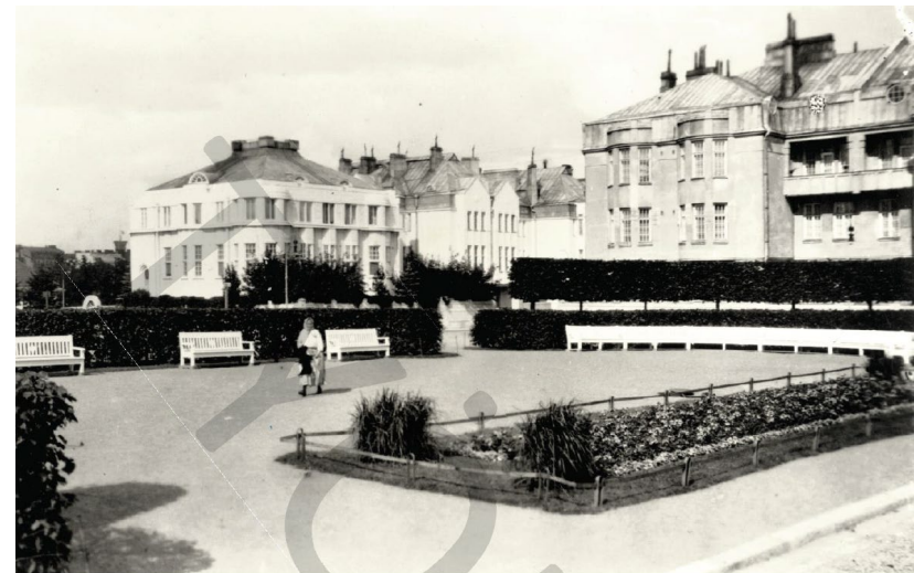
Engelplatsens parktorg år 1926.