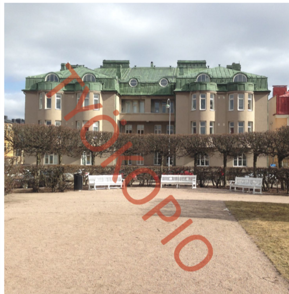
Engelinaukio Vård- och åtgärdsprogram 2017