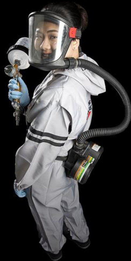
Kuva: Taitaja2017 "Ole hyvä" -lajikuva