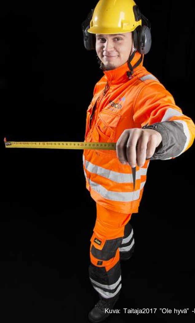
Kuva: Taitaja2017 "Ole hyvä" -lajikuva