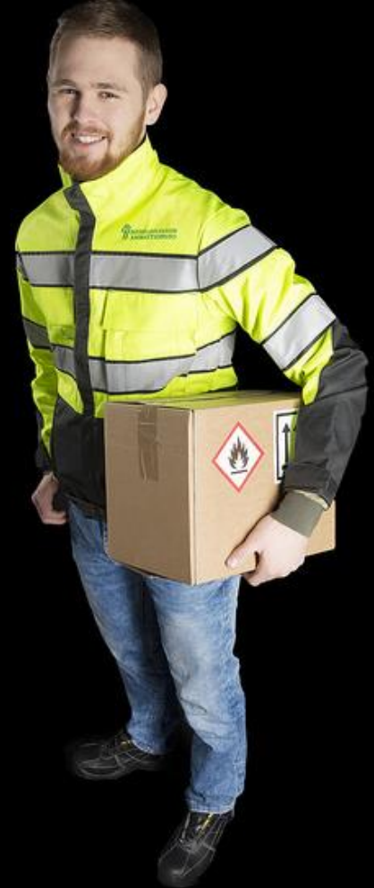
Kuva: Taitaja2017 "Ole hyvä" -lajikuva