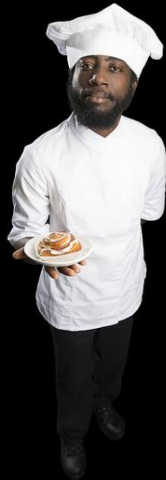
Kuva: Taitaja2017 "Ole hyvä" -lajikuva