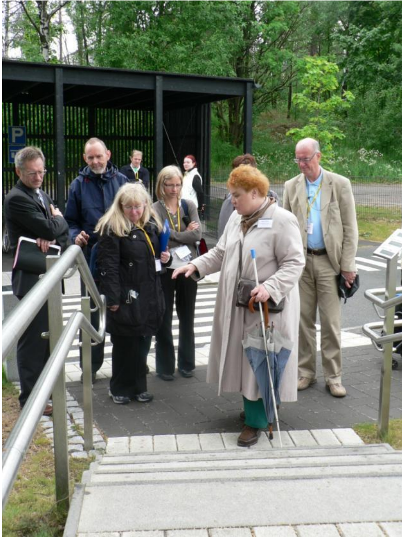
Elsatuote-kehityshankkeen tuotteita on nähtävillä Lasten liikennekaupunkiin rakennetussa ulkoalueiden esteettömyystuote -näyttelyssä Esterissä