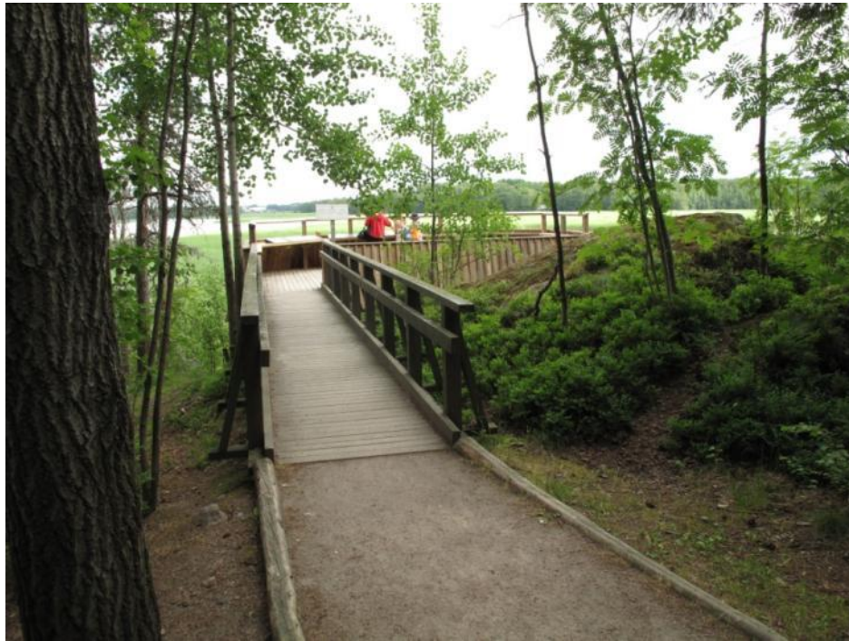
Polku päättyy esteettömälle lintulavalle