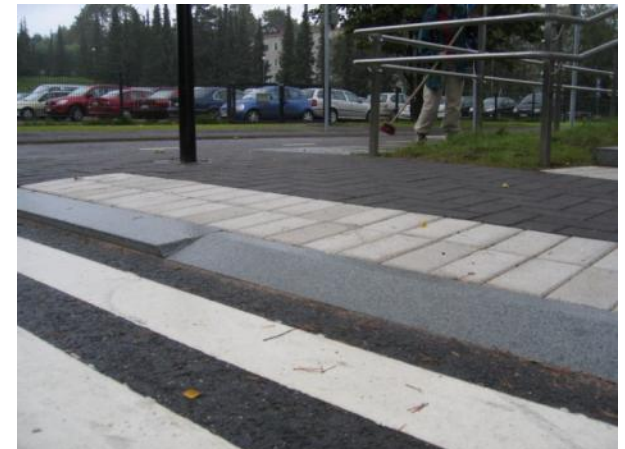
Pystysuora- ja luiskareunatuki, luonnonkivi