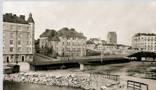
EBENESERHEMMET. HSM/OKÄND, 1919.

Ebeneserhemmet, som blev färdigt 1908, ritades av arkitekt Wivi Lönn. Här fanns ett förberedande seminarium för barntädgårdslärare, barn-