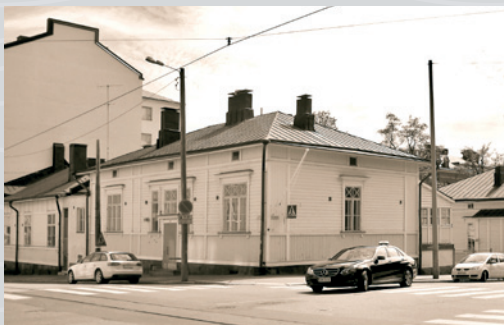
BRITA MARIA RENLUNDS DAGHEM.