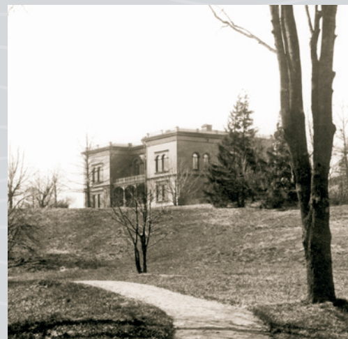
VILLA HAGASUND. 1902.