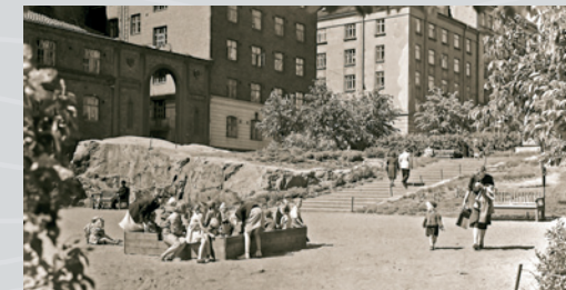
ALLI TRYGGS PARK.

tri Vala (Karin Wadenström, 1901–1944), som hörde till författargruppen Tulenkantajat, bodde tillsammans med sin man på Vilhelmsbergsgatan 7–9 från hösten 1931 till våren 1933. Hon ville identifiera sig med arbetarbefolkningen och bo bland den. Hon har beskrivit stämningarna på Marjatanmäki i sin dikt Kesäilta laitakaupungilla (Sommarkväll i stadens utkanter).