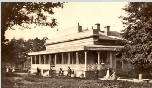
KAJSANIEMI RESTAURANG. HSM / EUGEN HOFFERS, 1860-TALET.