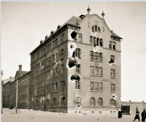
BORGSTRÖMS TOBAKSFABRIK.