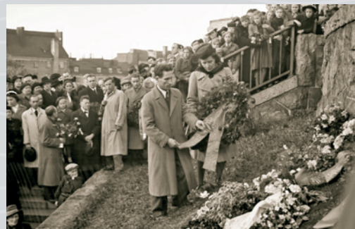
KATRI VALAS PARK.