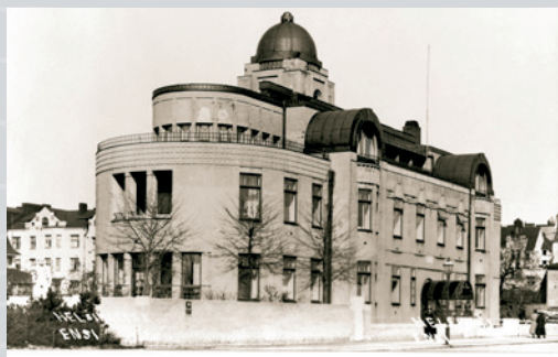
VILLA ENSI.