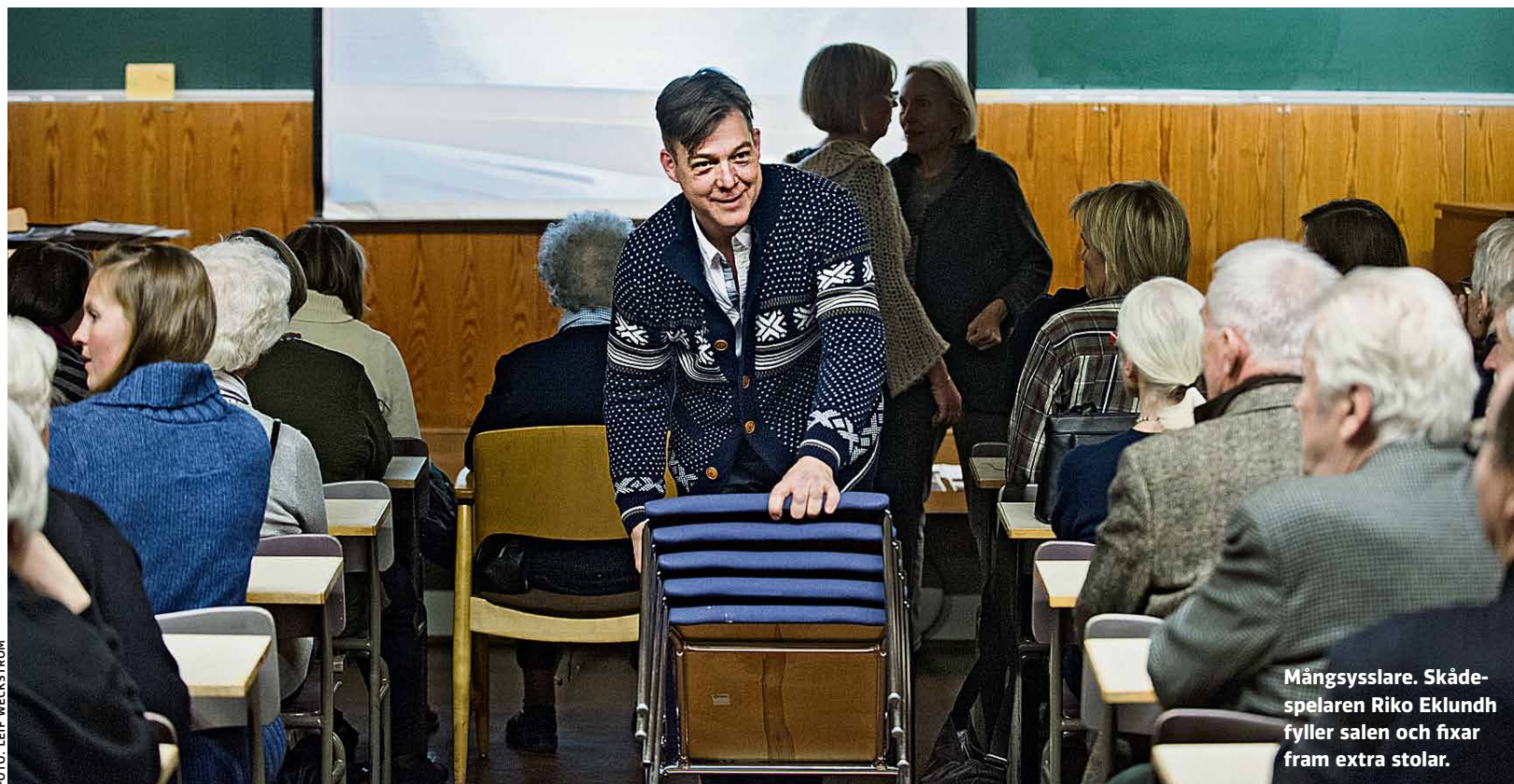
Mångsysslare. Skådespelaren Riko Eklundh fyller salen och fixar fram extra stolar.