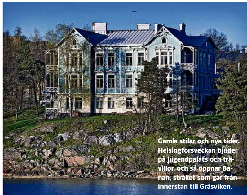
Gamla stilar och nya tider. Helsingforsveckan bjuder på jugendpalats och trävillor, och så öppnar Banan, stråket som går från innerstan till Gräsviken.

Ytterligare perspektiv på stadsbilden ger den guidade turen i Nordsjö och så det historiska dramat utgående från Carl Ludvig Engel och hans samtida. Och så kan man ta del av temat Helsingfors 200 år som huvudstad genom att flanera med guide längs Alexandersgatan. Rutten med namnet På andra sidan om Långa bron skildrar arbetarstadsdelen Berghäll och något av den urbana staden i ett nötskal ger presentationen av finsk skodesign med start vid Norra esplanaden. Bulevarden från öster till väster ger en inblick i stadens arkitekturstilar, liksom