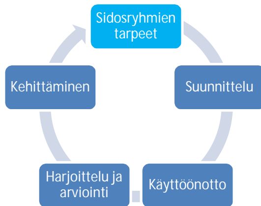
Kuva 2. Jatkuvuudenhallinnan prosessi

Lähtökohtana on, että organisaatio tunnistaa eri toimintaansa kohdistuvat sidosryhmien tarpeet, jotka voivat olla toimialan sektorilainsäädäntöä, ohjaavan ministeriön tai viranomaisten ohjeita, kaupunkikonsernin sisäisiä tai asiakkaiden tarpeita, kaupunkitasoisia päätöksiä tai eri toimijoiden kanssa tehtyjä sopimuksia.