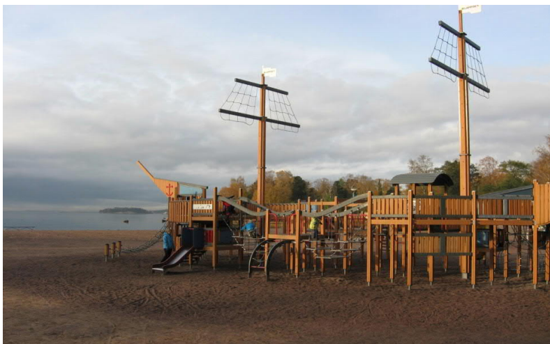
Lekredskap för barn på Drumsö strand