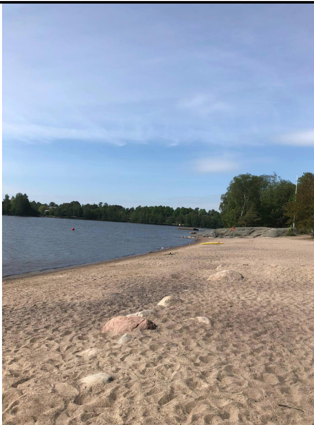
Blåbärslandets badstrand 2020