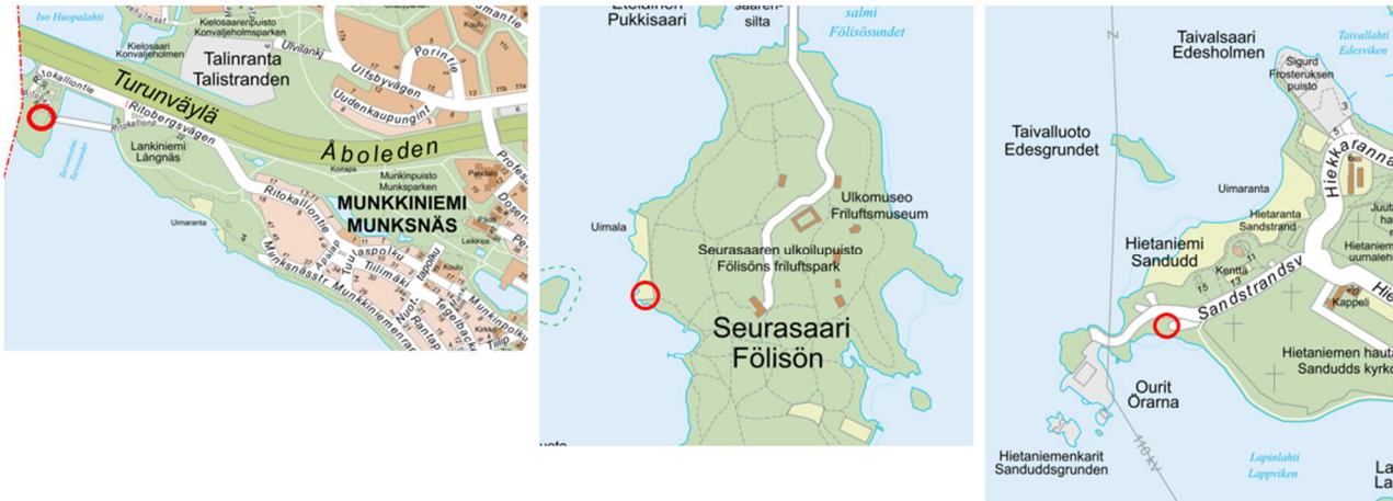
Kuvassa Tarvon, Seurasaaren ja Hietaniemen saunapaikkojen sijainnit

Helsingin kaupunki hakee vuokralaista ja toteuttajaa kolmelle merelliselle saunapaikalle. Haettavat saunapaikat sijaitsevat Tarvossa (n. 250 k-m 2 ), Seurasaarella (n. 130 k-m 2 ) ja Hietaniemessä (n. 150 k-m 2 ).