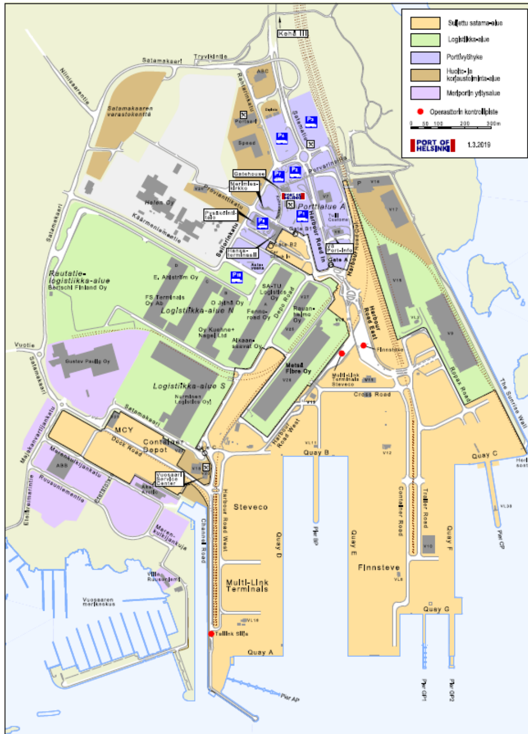
Kuva 1. Aluekartta Vuosaaren satamasta.

Satama-alueella on konttilaituria yhteensä 2 x 750 metriä. Ro-ro-aluksille paikkoja on 16 kpl. Suljettua satama-aluetta kiertää porttivyöhyke. Se jakautuu alueisiin A, B ja C. Porttialue A on pääkulkuväylä suljetulle satama-alueelle. Liikkuminen porttialueella A on sallittu vain raskaalle satamalle tulevalle lastiliikenteelle. Porttivalvomossa on sisääntulon tarkastuspiste ja valvomotoiminnot.