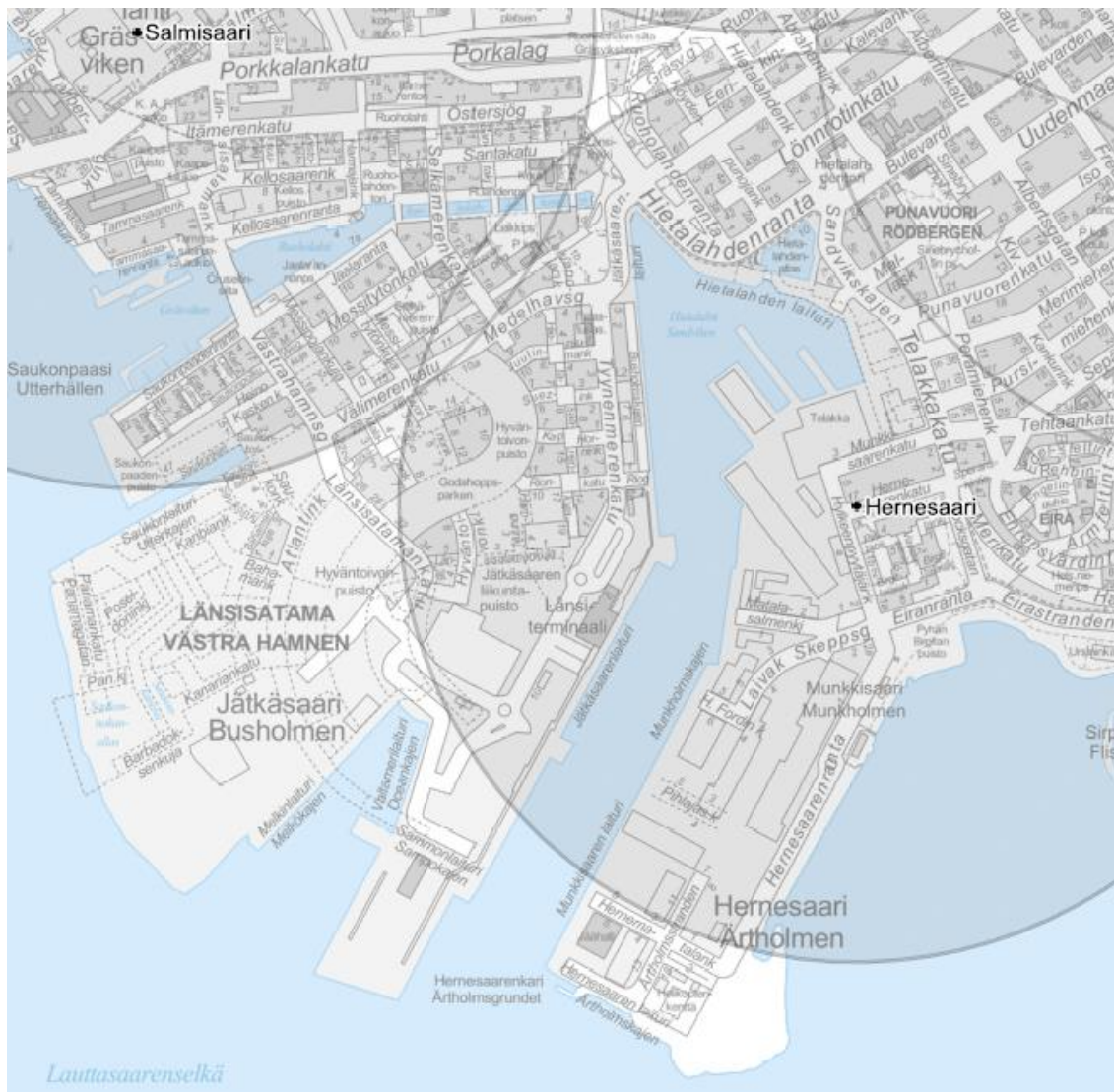
Kuva 4. Väestöhälyttimien kuuluvaluusalueet esitetty harmaalla rasteroinnilla.

https://www.hel.fi/pela/sv/Raddningsverksamhet/Handla+pa+ratt+satt+i+olycksituationer/