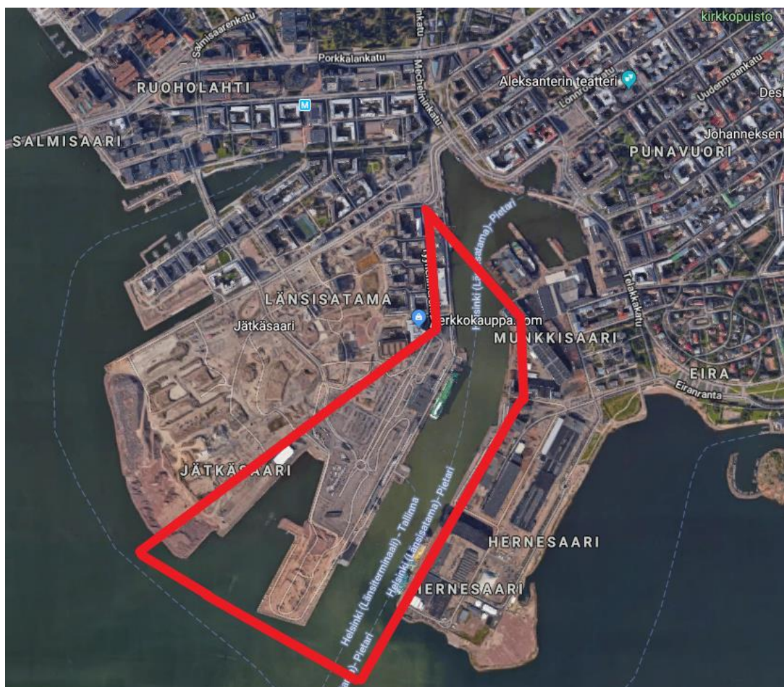
Kuva 1. Ilmakuva Länsisataman alueesta. Satama-alue rajattu punaisella värillä.

Länsisatama sijaitsee Ruoholahden kaupunginosan eteläpuolella Jätkäsaaren rakentuvan kaupunginosan kanssa samalla niemenkärjellä (kuva 1). Länsisatamaan kuuluvia laitureita sijaitsee myös viereisellä Hernesaaren niemellä, joka on satamaltaan toisella puolella. Liikenneyhteydet Länsisatamaan ovat lännen suunnasta hyvät, sillä satama-alueen läheltä alkaa Länsiväylä. Idän suunnasta lähestyminen tapahtuu sen sijaan kaupungin keskustan kautta. Asuin-, toimisto ja majoitusrakennuksia sijaitsee satama-alueen lähellä useilla eri asuinalueilla.