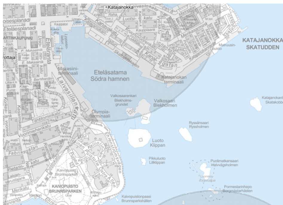
Kuva 4. Väestöhälyttimien kuuluvaluusalueet esitetty harmaalla rasteroinnilla.

https://www.hel.fi/pela/sv/Raddningsverksamhet/Handla+pa+ratt+satt+i+olyckssituationer/