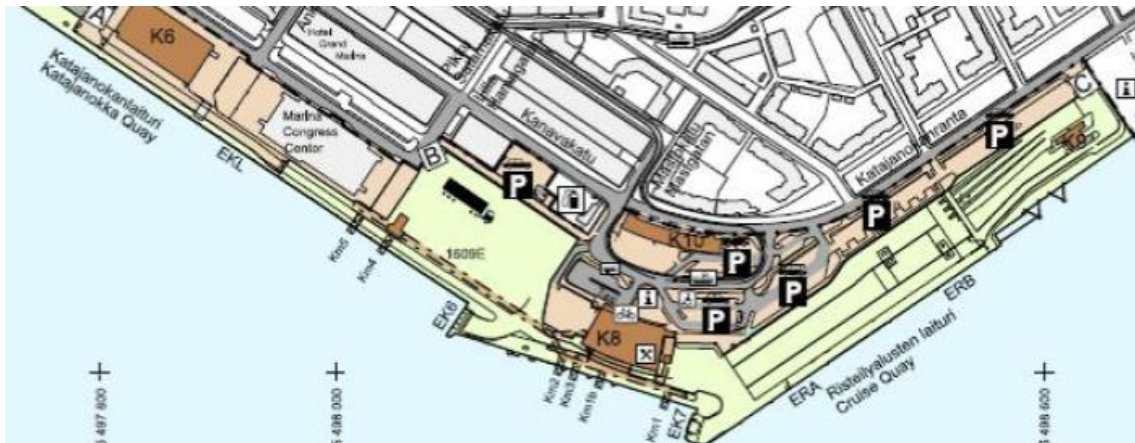
Kuva 3. Katajanokan terminaalien aluekuva.