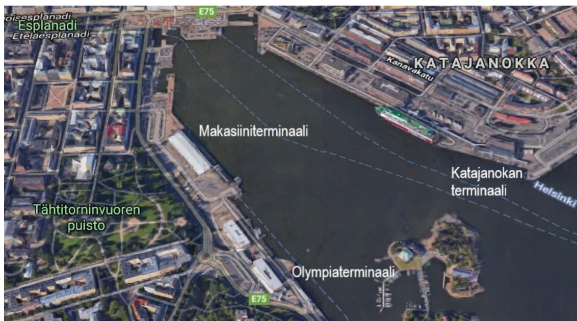
Kuva 1. Ilmakuva Eteläsataman alueesta.

Eteläsatama toimii pelkästään matkustaja-alusten satamana. Se sijaitsee aivan kaupungin ydinkeskustassa Kauppatorin molemmin puolin jakautuen kolmeen erilliseen matkustajaterminaaliin. Olympiaterminaali ja Makasiiniterminaali sijaitsevat satamaltaan länsilaidalla ja Katajanokan terminaali itälaidalla (kuva 1). Niin Katajanokan kuin Kaivopuistonkin puolella asutusta on aivan satama-alueen välittömässä läheisyydessä. Lisäksi satama-alueen välittömässä läheisyydessä sijaitsevat muun muassa Presidentinlinna, Kauppatori sekä merkittävä suurlähetystöalue.