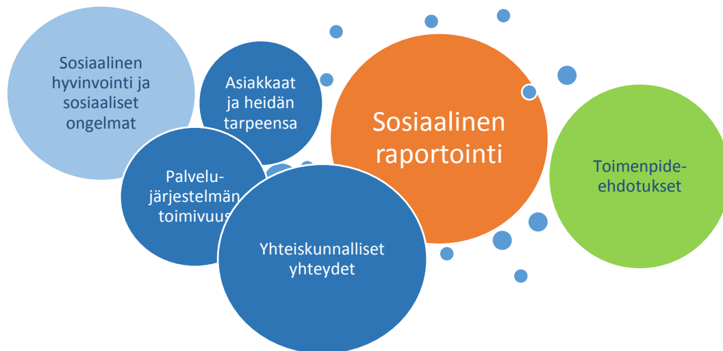
Kuvio 1 Sosiaalinen raportointi osana rakenteellista sosiaalityötä