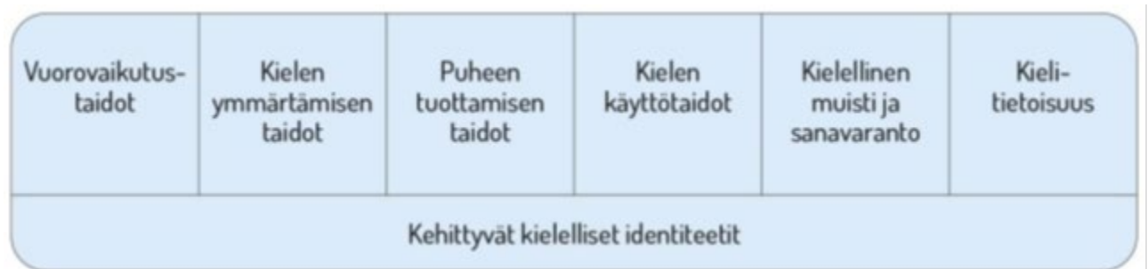
Kuvio 1. Lasten kielen kehityksen keskeiset osa-alueet esiopetuksessa

Kielen oppimisen kannalta on tärkeää tiedostaa, että saman ikäiset lapset voivat olla eri vaiheissa kielen kehityksen eri osa-alueilla. Lasten kielelliset identiteetit (kuvio 1) kehittyvät, kun heitä ohjataan ja tuetaan kielellisten taitojen ja valmiuksien keskeisillä osa-alueilla.