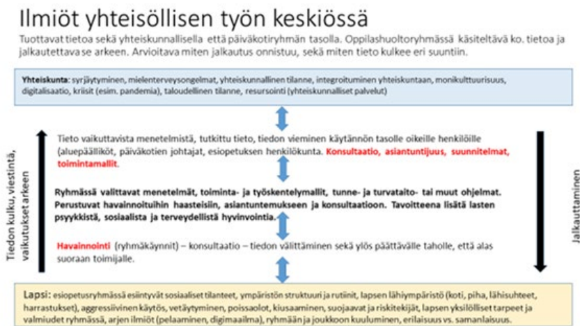
Kuva 2 Lasten ja esiopetusryhmien kokonaisvaltaiseen hyvinvointiin liittyvät alueelliset ilmiöt

Moniammatillisessa yhteisöllisessä keskustelussa voi nousta esiin myös tarve yksilölliselle oppilashuoltotyölle. Tällöin käydään yhdessä huoltajien kanssa keskustelua siitä, millaista tukea lapsi tarvitsee esiopetusvuonna. Oppilashuollon työntekijät osallistuvat myös konsultoihin tapaamisiin huoltajien ja esiopetuksen työntekijöiden kanssa.