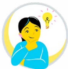
Förmågan att tänka och lära sig