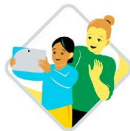
Förskola: digital kompetens