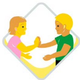
Kulturell och kommunikativ kompetens