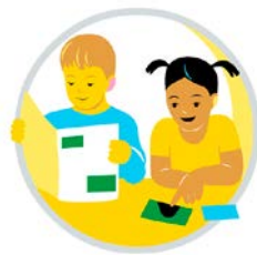
Multilitteracitet och digital kompetens