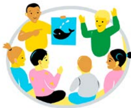
Förmåga att delta och påverka