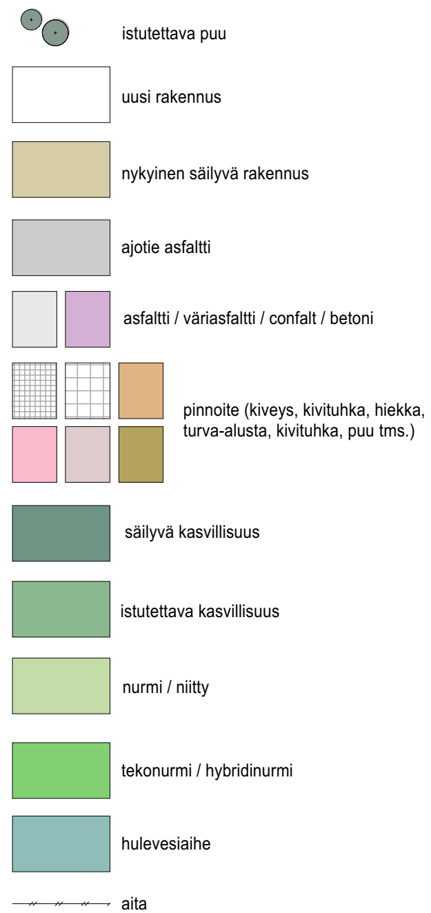
Käpylän liikunta- ja tapahtumapuisto Yleissuunnitelmaluonnos 1:2000