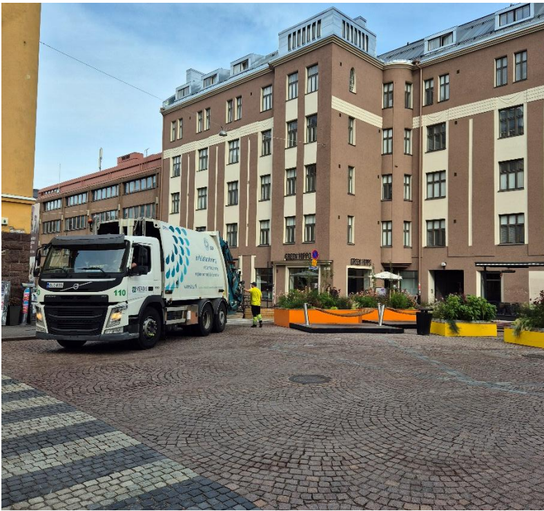
Kuva 6. Jätehuoltoa Franzéninaukiolta.

Porthaninkadulla tapahtui vuoden 2024 ja 2025 havainnointikertojen aikana hyvin vähän huoltoliikennetapahtumia, minkä lisäksi yksi havaituista huoltoliikenteen ajoista jalkakäytävälle tapahtui Kolmannen linjan puolella Porthaninkadun ja Kolmannen linjan risteysaluetta. Toisin kuin vuonna 2024, jolloin huoltoajoa tapahtui tasaisesti kadun keski- ja pohjoisosassa, kesällä 2025 huoltoliikenteen toimenpiteet ja pysäköinti huoltoliikenteen paikoilla keskittyi kahteen kohtaan, yksi kadun pohjoispäässä ja yksi eteläpäässä.