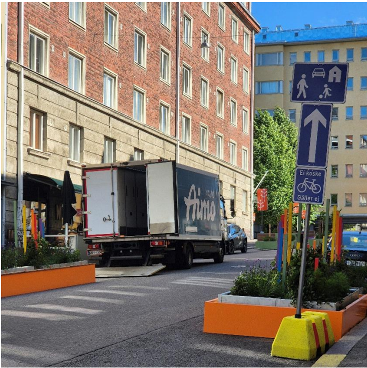
Kuva 5. Kuormaustoimintaa Fleminginkadun ajoradalla.