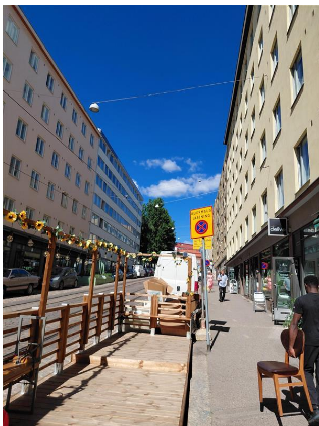
Kuva 2: Kuormauspaikka ravintola Oivan edessä Porthaninkadulla.