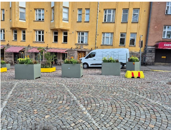
Kuva 4. Huoltoajoa Agricolankadun jalkakäytävällä. Kadun ajoradalle oli kesäkatujen ajaksi lisätty kuormauspaikka n. 10 metrin päähän kuvasta oikealle.

Fleminginkadulla havaittiin kaikista kaduista eniten kiellettyyn ajosuuntaan ajamista erityisesti Fleminginkadun ja Agricolankadun risteysalueella, mutta tämä ei liittynyt yksinomaan huoltoliikenteeseen. Risteysaluetta havainnoidessa oli huomattavissa, että kuskit näkivät ja tunnistivat kielletyn ajosuunnan merkin ja tästä huolimatta ajoivat kiellettyyn ajosuuntaan. Fleminginkatu oli yleisesti kolmesta tarkastellusta kadusta hiljaisin moottoriajoneuvoliikenteen kannalta. Erityisesti Agricolankadun pohjoispuolella Fleminginkadulla oli melko vähän moottoriajoneuvoliikennettä. Kallion kirjaston itäpuolella olevalla taksiasemalla ei havainnointiajankohtina ollut takseja pysäköitynä tai odottamassa.