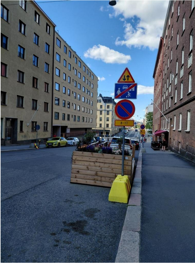
Kuva 3: Päiväajan huoltotoiminnan mahdollistava pysäköintikieltomerkki Fleminginkadun pohjoispäässä.