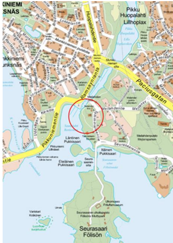
Kuva 1. Suunnittelualueen sijainti.