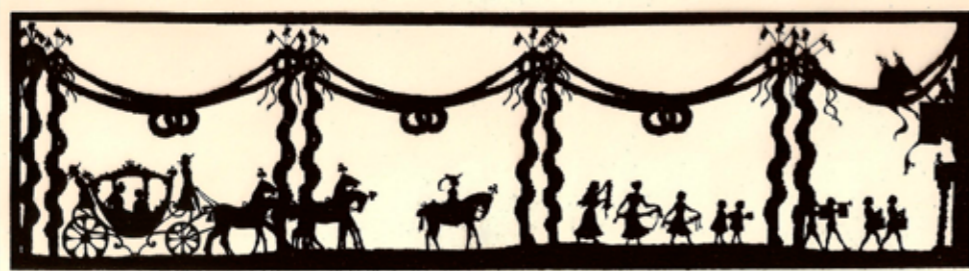
Kohtaus Per och Brita –varjoteatteriesityksestä.