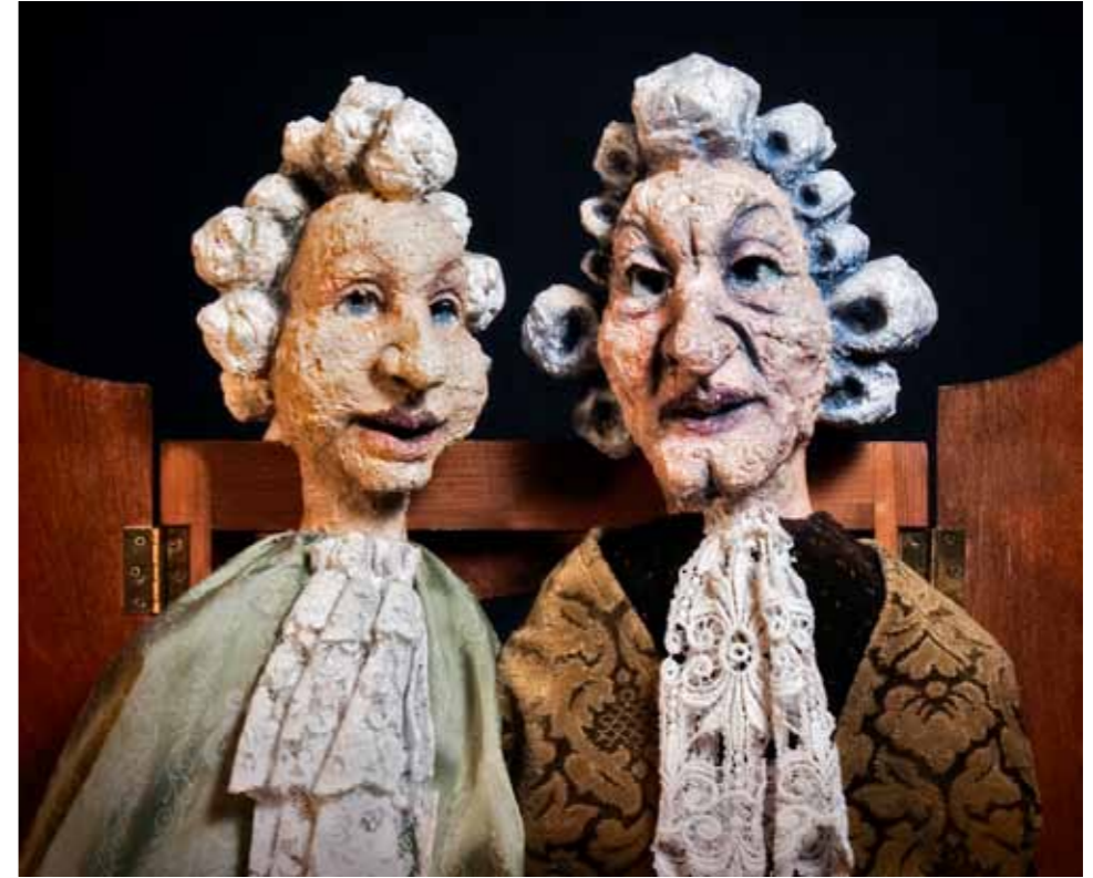
Nukketeatterikeskus Poiju: Meidän Mozart.

Vaikka nukketeatteri on vahvasti Suomessa ollut pääasiassa lapsille tarkoitettu taidemuoto, se on syntynyt aikuisten tarpeeseen. Nukketeatteri on toiminut mytologian ja uskonnon visualisoimisen välineenä. Nukketeatteria käytetään edelleen ympäri maailman muun muassa kertomaan kulttuurien ja kansojen luomistarinoita.