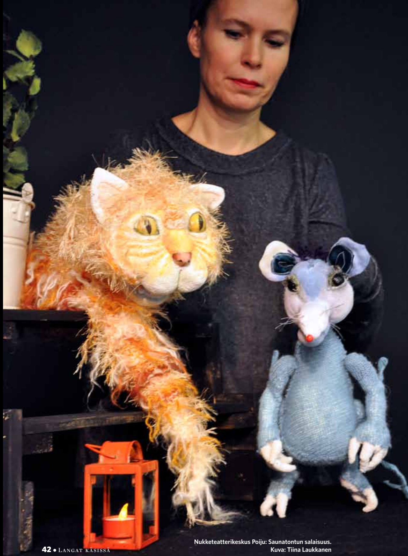
Nukketeatterikeskus Poiju: Saunatontun salaisuus.