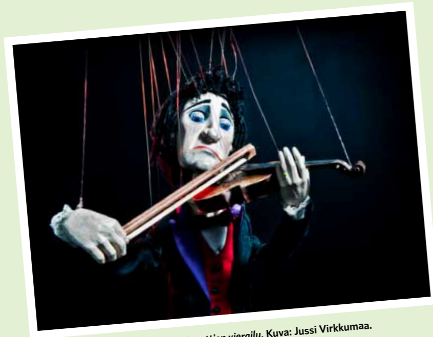
Nukketeatterikeskus Poiju | Marionettien vierailu.