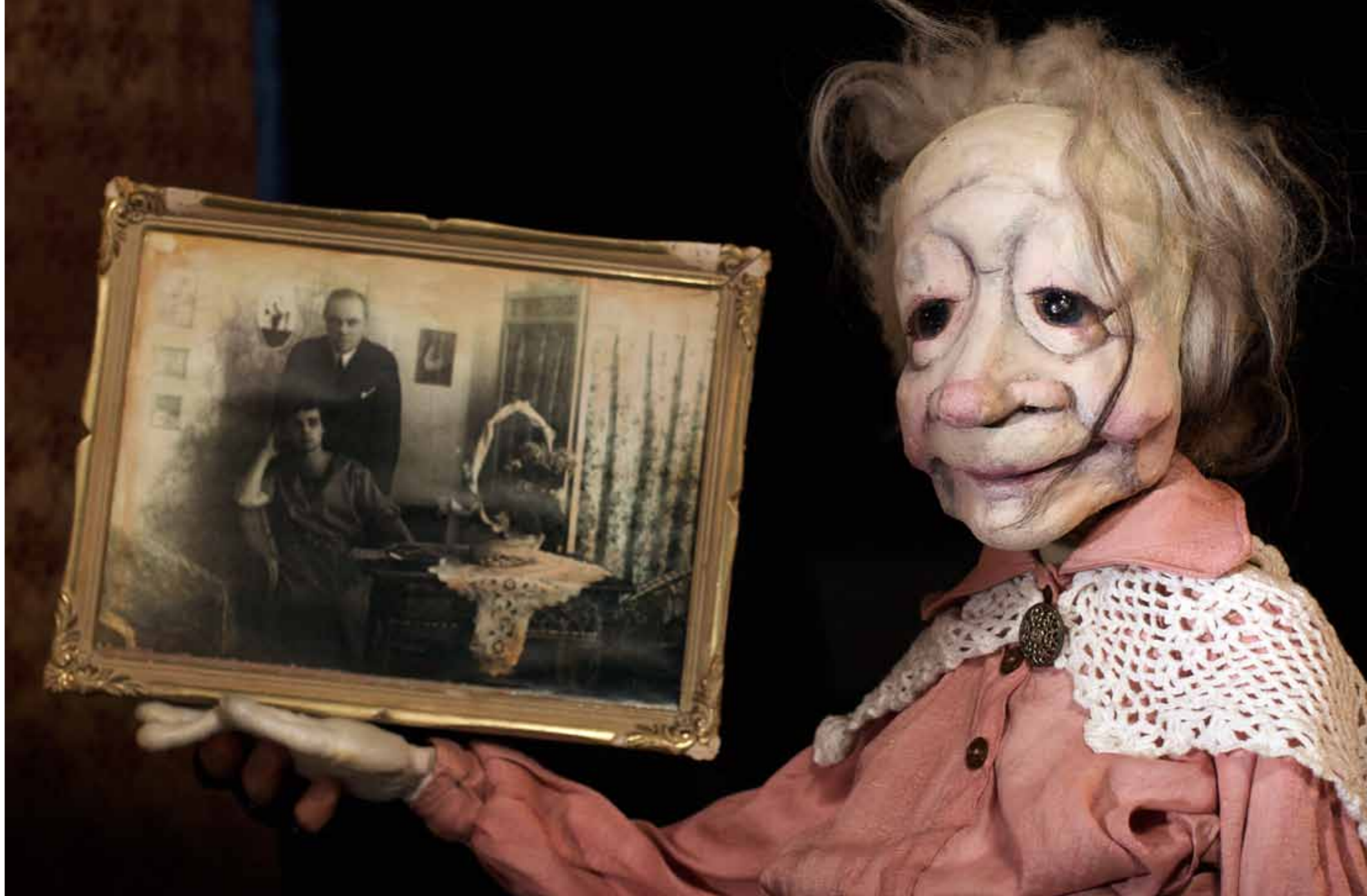
Nukketatterikeskus Poiju: Ofelia ja Varjojen Teatteri.

joteattereita, kuten myös käsinukkeja ja marionetteja, tuotiin suomalaisille lapsille lahjoina porvariston ja yläluokan perheiden Euroopan matkoilta. Monissa perheissä esitettiin näillä kotinukketatteria. Helsingin kaupunginmuseon konservoima ns. "Paciuksen teatteri", pahvinen pienoiste-