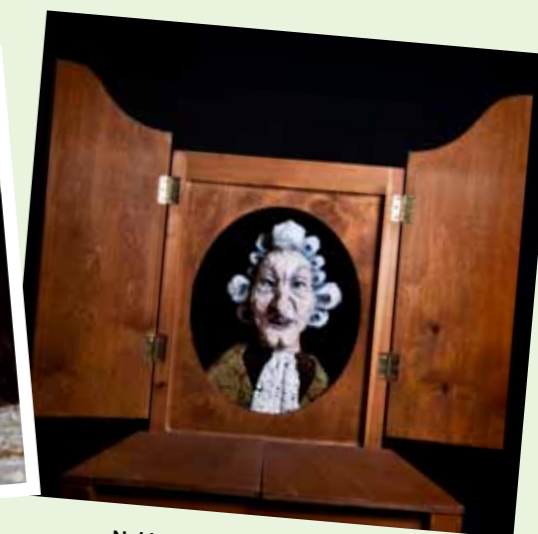
Nukketeatterikeskus Poiju: Meidän Mozart.