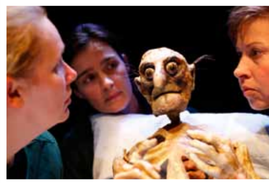
Anatomia Lear.