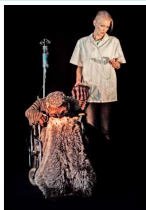
Satu Paavola: Betty 'Sis' O'Valley. Bojan Barić: Marionettien vierailu.