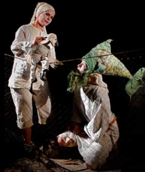
Vasemmalla: Nukketheateri-ANNOS: Ihmeiden markkinat.

Tämä raportti on osa kulttuurilautakunnan Poijulle myöntämää kolmivuotista kehittämishanketta.