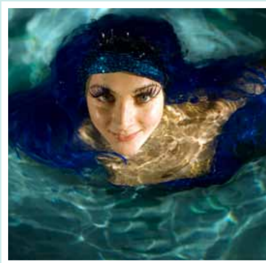
Tanssiteatteri Hurjaruuth: Pieni Merenneito.