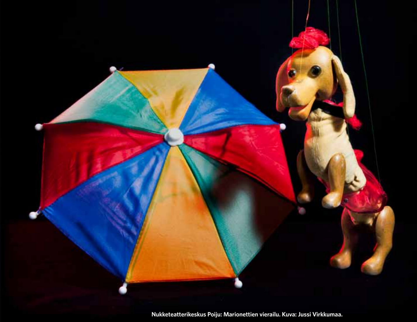
Nukketeatterikeskus Poiju: Marionettien vierailu.