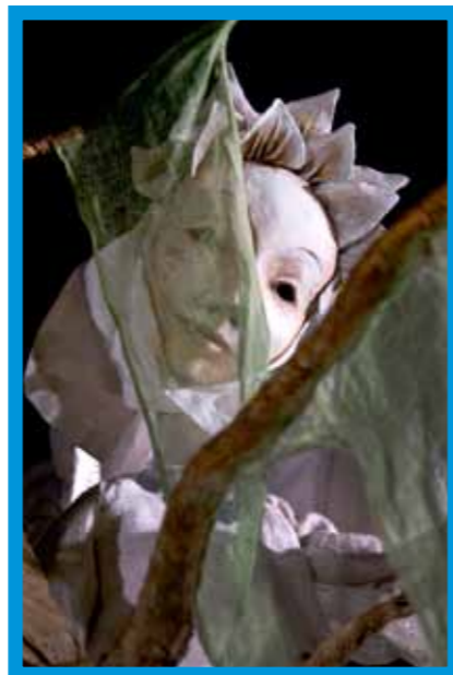
Vas: Nukketeatterikeskus Poiju: Joutsenpoika Jykserge. Kuva: Jussi Virkkumaa Alla: Nukketeatterikeskus Poiju: Marionettien vierailu. Kuva: Jussi Virkkumaa.

S UOMALAINEN NUKKETEATTERI on 100 vuoden kuluessa kehittynyt marginaalisesta taidelajista vakavasti otettavaksi ja taiteellisesti haastavaksi teatterisuuntaukseksi, joka tavoittaa nykyään satojatuhansia katsojia. Tuoreena ilmiönä ovat lukuisat aikuisille ja nuorisolle suunnatut produktiot, jotka ovat tuoneet uusia yleisöryhmiä esityksiin sekä laajentaneet nukketeatterin vaikutuskenttää. Viimeisimpiä aikuisille suunnattuja nukketeatteriesityksiä ovat Nukketeatterikeskus Poijun ja Linnateatterin yhteistuotanto 3D – Dirty, Difficult and Dangerous, Anatomia Ensemblen Anatomia Lear ja Hox Companyn John Eleanor.