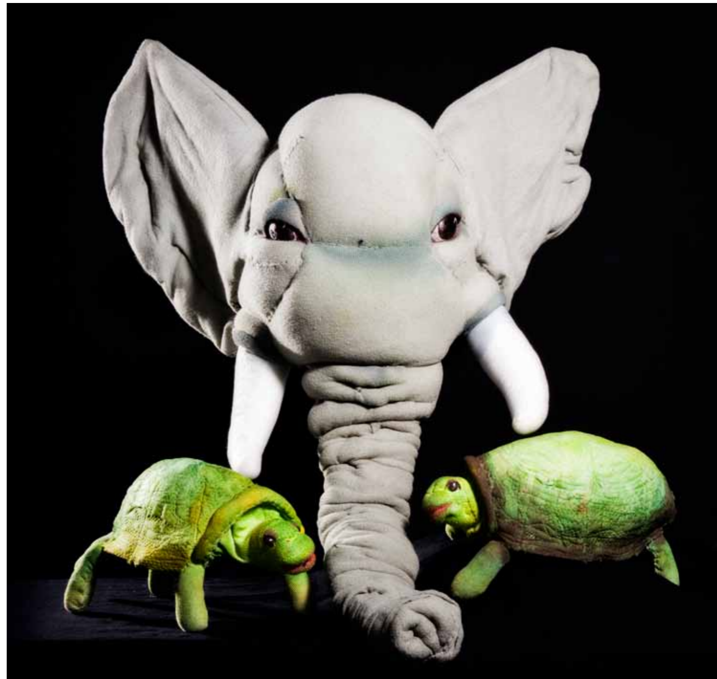
Nukketeatterikeskus Poiju: Satusafari.

Tarkempi selvitys eri maissa toimivista nukketeatterikeskuksista on liitteessä 2.