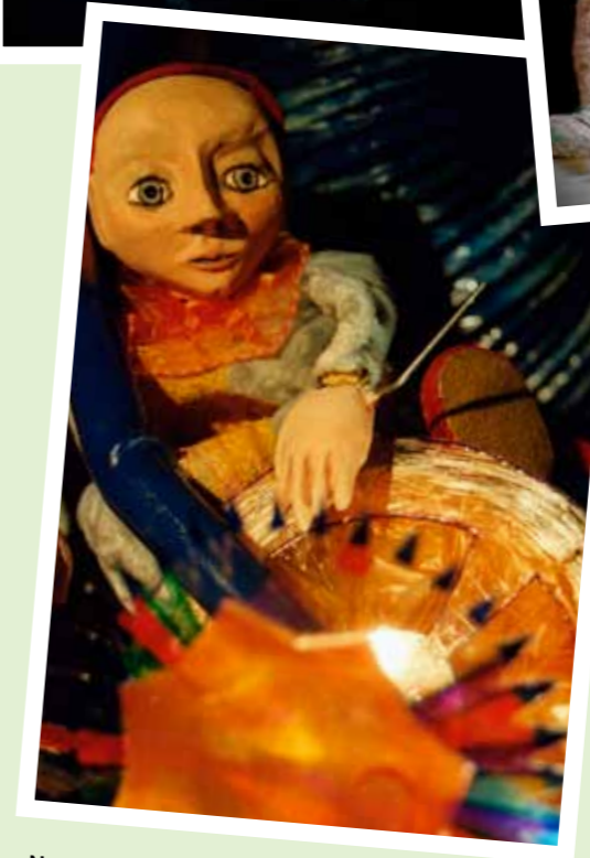
Nukketeatteri-ANNOS | Sirkustyttö