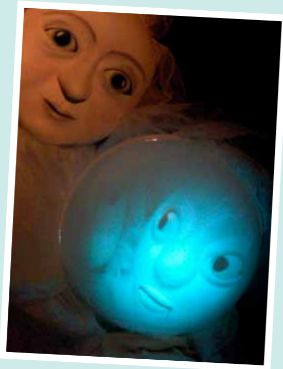
Nukketeatteri-Annos: Rouva Talvi.

Nykyään Anna toimii myös Nukketeatterikeskus Poijussa PoijuPaikkalaisena.