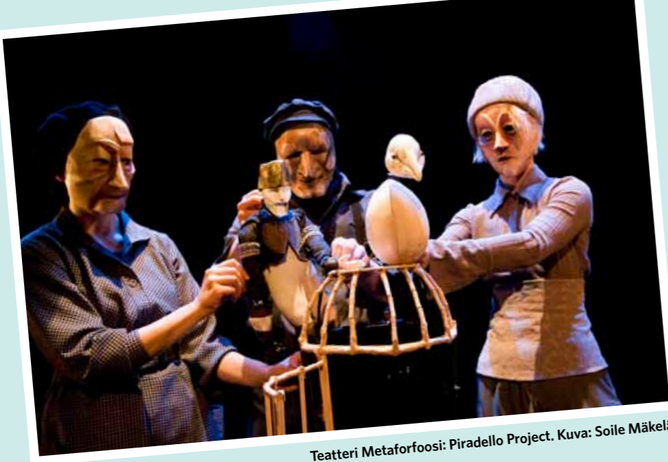
Teatteri Metaforfoosi: Piradello Project.