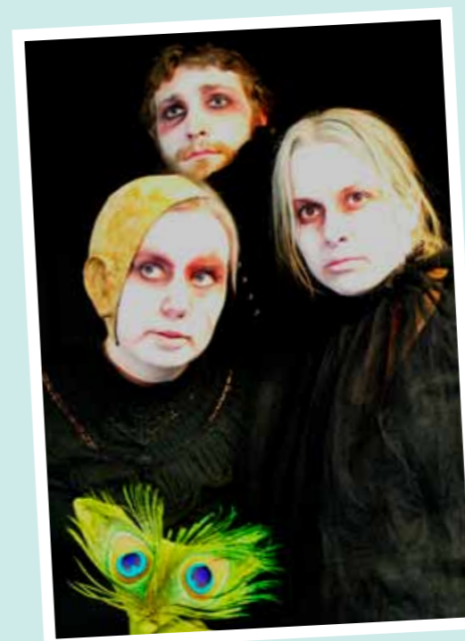
Bläkpox: Kummajaiset.