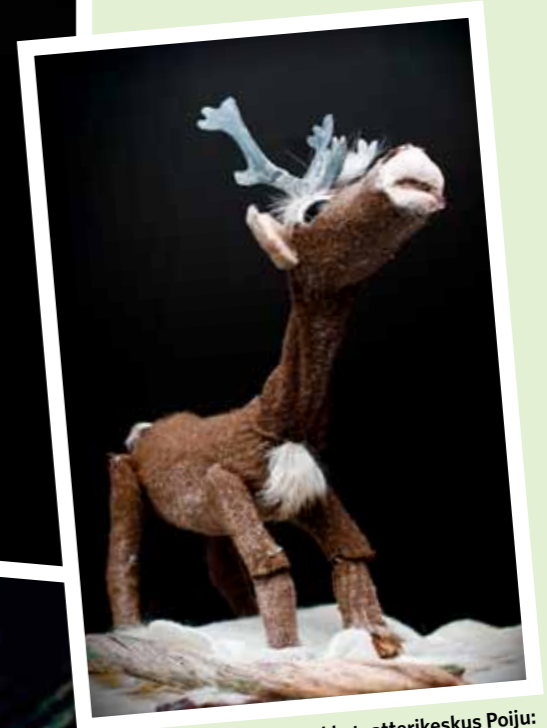
Nukketeatterikeskus Poiju: Muotkatunturin Kesukka