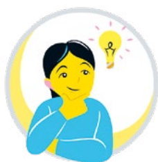
فکر کردن و یادگیری