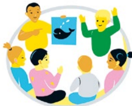
شرکت کردن و تأثیر گذاشتن