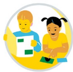
سواد چند جانبه و مهارت اطلاعات و ارتباطات