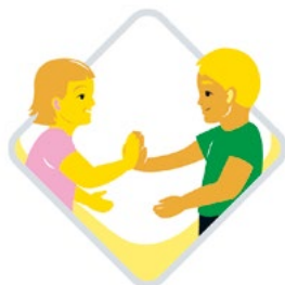
فرهنگی مهارت، تأثیر متقابل و بیان