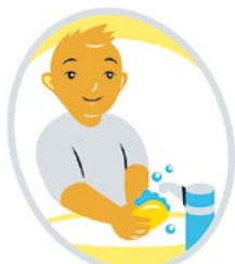
مراقبت از خود و مهارت های روزمره