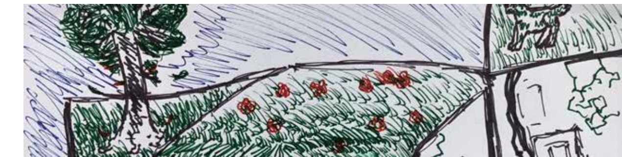
Talon katolla on mm. omenapuu, jonka omenat ovat todella hyviä (tiedän, koska olen maistanut niitä). Talon katolla on myös nurmikko ja mansikkapensaita. Katolla on myös kukkia kuten syysleimu.

Betonitalojen valmistuksen loputtua valmistui Suomen luontoystävällisin talo. Talon seinät on tehty puusta ja ikkunat on tehty nanoselluloosasta, joka on uusinta teknologiaa. Tunnettu materiaali-insinööri oli keksinyt tavan tehdä nanoselluloosasta ikkunoita. Talo on tehty uusiutuvista raaka-aineista kuten puusta. Talon katolla on viheralue, jossa on erilaisia viherkasveja. Tämä vihreä infrastruktuuri sitoo itseensä hiiliidioksidia ja imee itseensä sadeveden. Talo saa osan sähköistään aurinkopaneeleista ja loput muun muassa hukkapuiden polttamisesta ja maan sisältä poratusta lämmöstä. Lämmitys tulee ilmalämpöpumpusta.