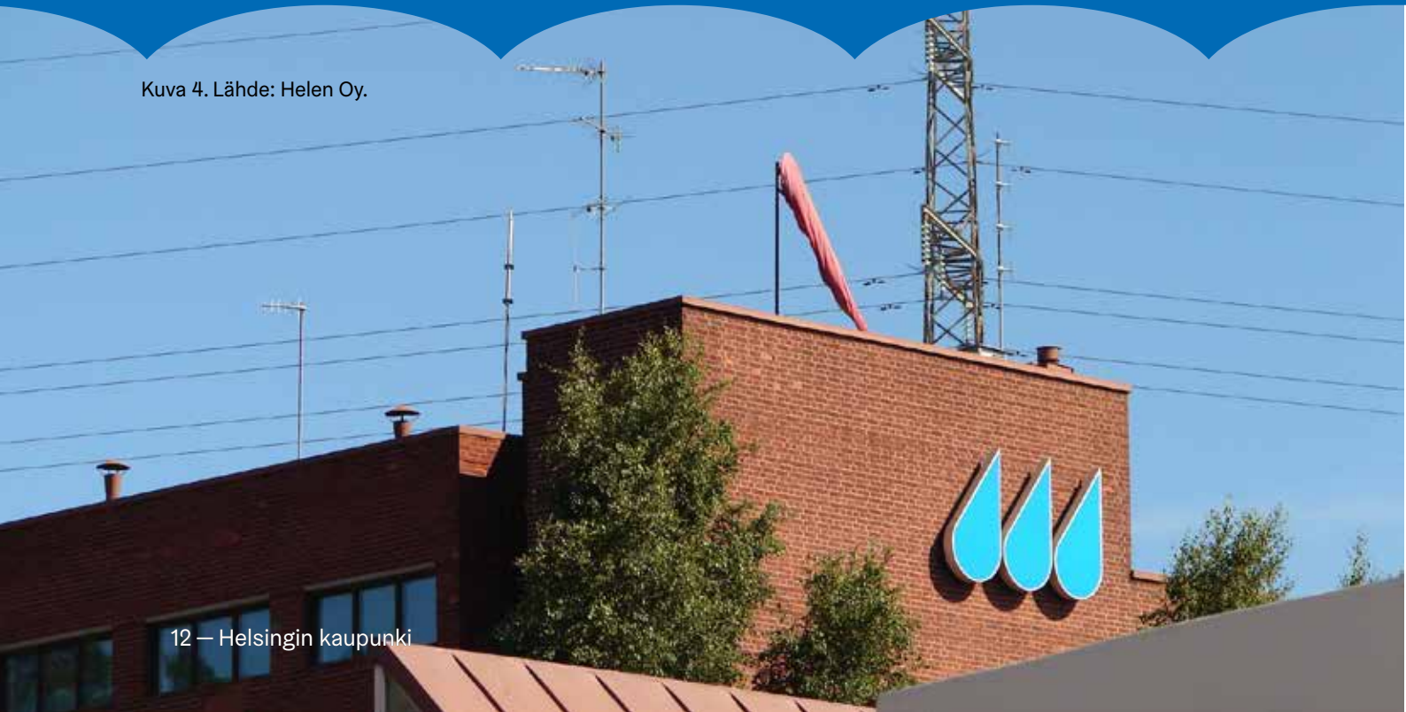
Kuva 4.

Yhteinen toiminta ja tiedonkulku eivät kuitenkaan tapahdu itsestään, vaan vaatii toimintatapojen suunnittelua ja harjoittelua. Osakeyhtiömuotoiset yritykset eivät ole automaattisesti varautumisvelvollisia, joten omistavien kuntien on ohjauksella varmistettava, että varautuminen toteutuu.