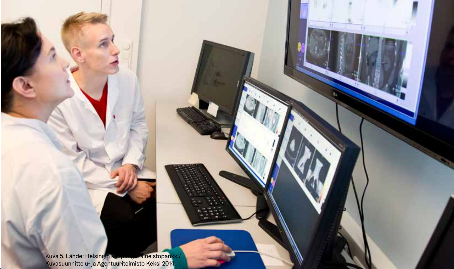
Kuva 5. Lähde: Helsingin kaupungin aineistopankki/ Kuvasuunnittelu- ja Agentuuritoimisto Keksi 2014.

Vihamielinen toimija voi yhdistää kyberkeinoihin fyysisen vaikutuksen. Kyberoperaatiolla voidaan muokata potilastietoja eli niin sanotusti puuttua tietojen eheyteen. Eheydellä tarkoitetaan kyberturvallisuudessa sitä, että tieto on vain niiden muokkaamaa, joilla siihen pitäisi olla mahdollisuus. Mikäli kyberoperaatiota ei havaittaisi, tietojen eheyteen luotettaisiin ja sen mukaisesti toimittaisiin. Tästä voisi olla konkreettisesti tuntevia fyysisiä seurauksia: kyberhyökkääjä voisi päästä vaikuttamaan ihmisten terveyteen siten, että lääkärit tekisivät väärä hoitopäätöksiä väärin potilastietojen takia.