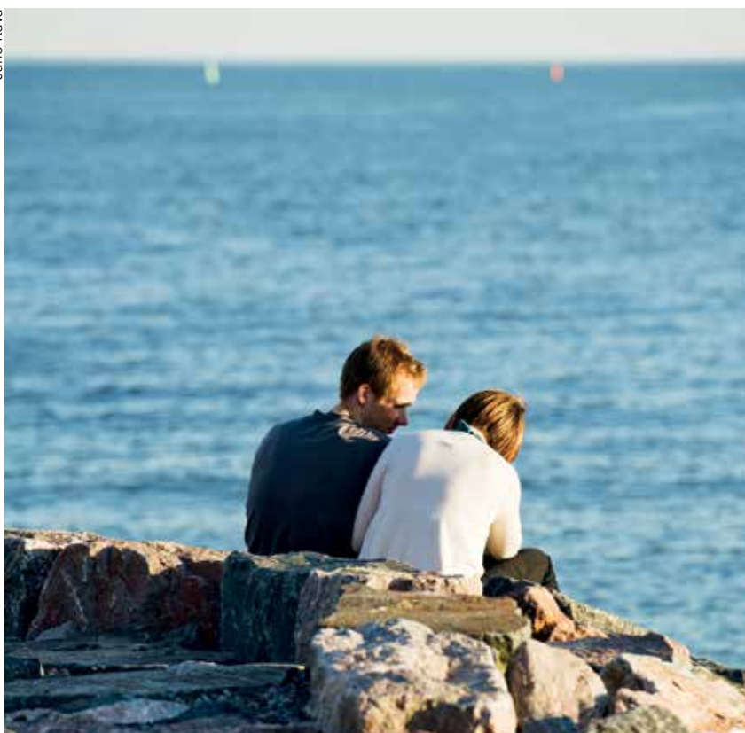
Suurimman osan vuodesta ilmanlaatu pääkaupunkiseudulla on hyvää tai tyydyttävää.

kasmäärän kasvusta ja kaupunkirakenteen tiivistymisestä.