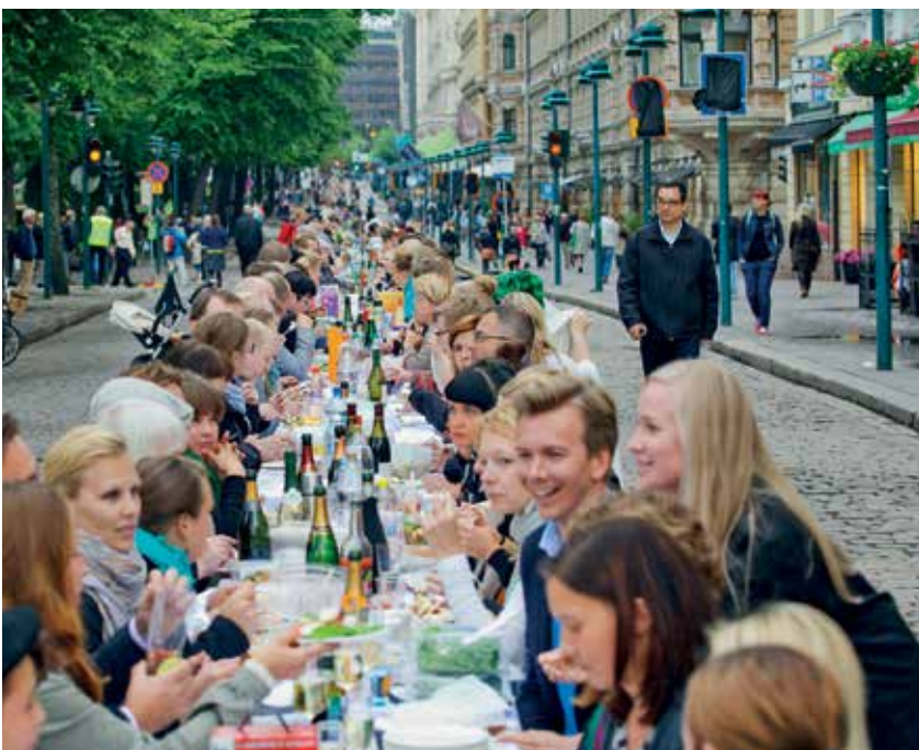
Illallinen Helsingin taivaan alla Pohjoisesplanadilla Helsinki-päivänä 12.6.2013.