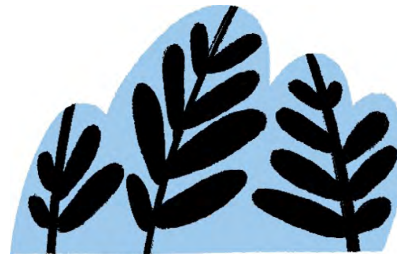
Kuvittaja: Lille Santanen