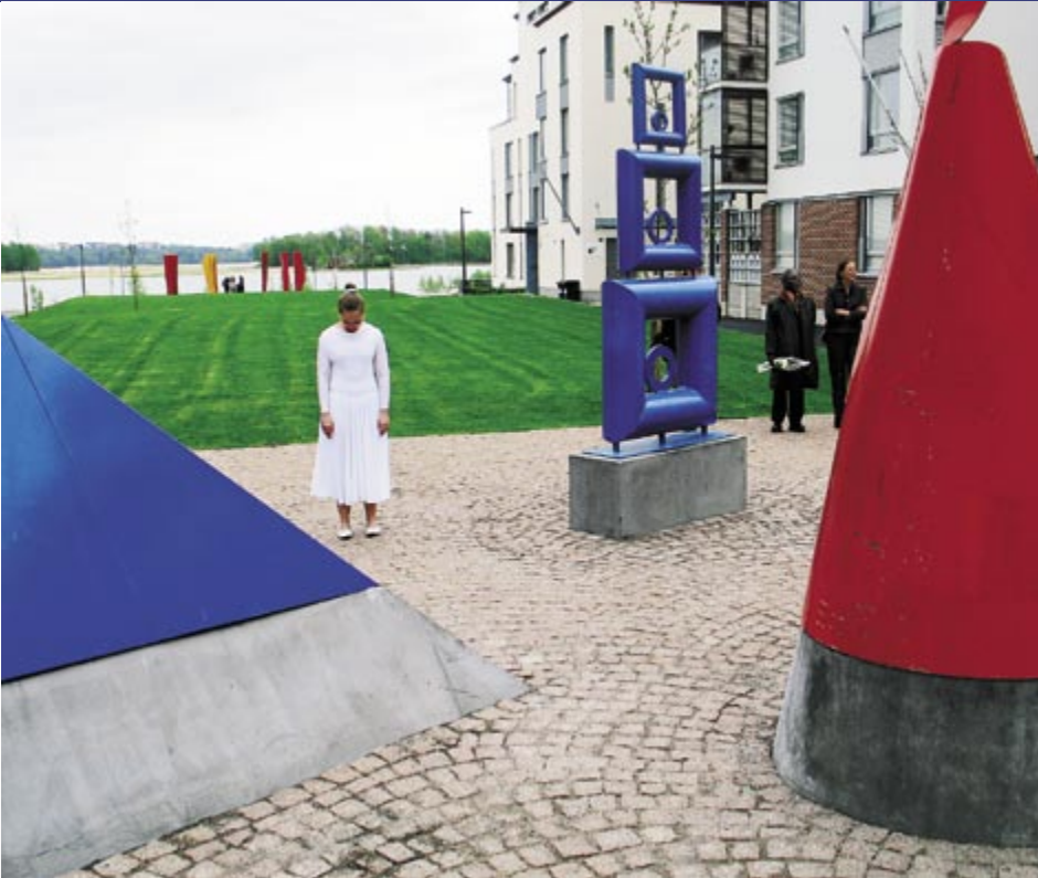
➔ Uudet alueet ovat entistä korkealuokkaisempia, esteettömpiä ja vaativampia hoitaa. Esim. Arabianrannassa taide tuli kadulle – kuva Kaj Franckin kadun avajaisista.