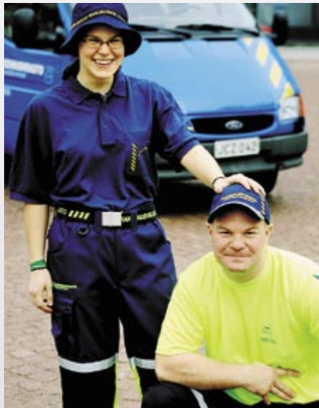
➤ Me sen teemme! Rakennusviraston taiturit ovat rakentaneet hyvää kaupunkia jo 130 vuotta.

Kokonaan uusia asuinalueita nousee monelle suunnalle, mm. Jätkäsaareen. Jätkäsaaren liikenneyhteydet paranevat, kun Länsisatamaa ja Ruoholahtea yhdistävä upea Crusellin silta valmistuu vuonna 2009. Sillan rakentaminen alkaa vuonna 2008.