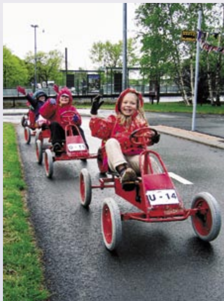
➔ Katuvihreä, reunakivet, pysäkkikiveykset – kaikki kuin oikeassa kaupungissa! Rakennusvirasto kunnosti lasten liikennekaupungin Laaksossa nuorisosiainkeskuksen tilauksesta.

HKR-Tekniikan liikevaihto pyritään nostamaan 60 M€:n tasolle mm. uusia asiakkaita hankkimalla. Nyt myynnistä 30–40 % kohdistuu rakennusvi-