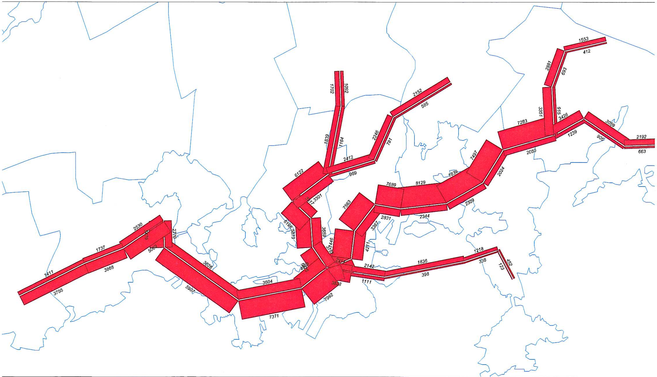
Metroverkon aamuruuhkaliikenteen ennuste v. 2025 ilman Santahaminan uutta maankäyttöä ja yhteyttä lentoasemalle