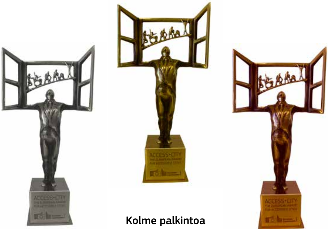
Kolme palkintoa Esteetön•kaupunki 2015 -kilpailu