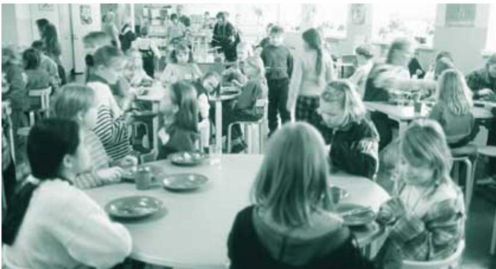
Koululaisten ruokailu kaupungin kouluissa toimii moitteettomasti.