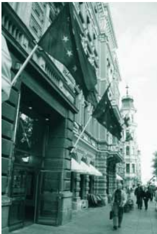
Helsingin tavoitteena on kehittyä Euroopan Unionin pohjoisen ulottuvuuden keskuksiksi.

Kaupungin tilinpäätös kertoo, että toimintamenot toteutuivat erittäin hyvin talousarvion mukaisina. Ainut selkeä poikkeama olivat erikoissairaanhoidon menot, joissa ylitys oli 112 milj. mk. Tulos muodostui kuitenkin positiiviseksi, koska talouden suotuisaa kehitystä heijasteleva yhteisöveron tuotto oli parempi kuin talousarviota tehtäessä saatettiin arvioida. Palloista perittävien tuloverojen kehitystä sen sijaan ei voi pitää tyydyttävänä. Kaupungin talouden tulevai-