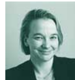
Toinen varapuheenjohtaja Tuija Brax