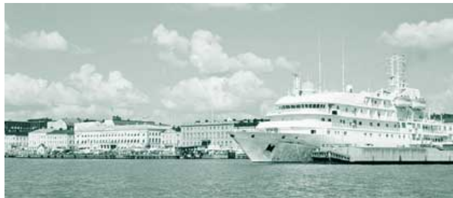
Katajanokan ranta on suosittu risteilijöiden viivähtämissaikka.

Helsingin Tekstiilipalvelun toiminnan 40-vuotisjuhlavuosi ja toinen tuotantovuosi liikelaitoksena toteutui taloudellisesti tuloksellisena. Myös hankintakeskuksen ja Helsingin Tukutorin toiminnot ovat kehittyneet myönteisesti ja vastanneet hyvin asiakkaiden asettamiin vaatimuksiin.