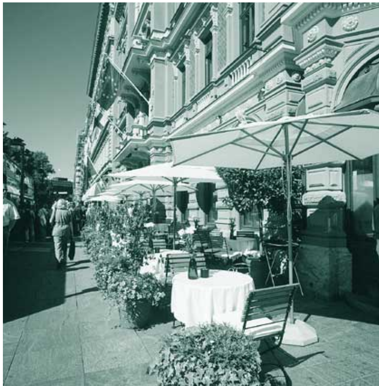
Kaupungin keskustaa on pyritty entisestään elävöittämään. Kaupunkikuvaan on tullutkin muun muassa lukuisa määrä viihtyisiä katukahviloita.

Uusi maankäyttö- ja rakennuslaki, joka edellyttää vuorovaikutteista suunnittelua tuli voimaan vuoden 2000 alussa. Uudistuksen edellyttämää rakennusjärjestystä valmisteltiin rakennusvalvontavirastossa ja keskushallinnossa. Uuden lain edellyttämiä menettelytapoja otettiin käyttöön jo vuonna 1999.