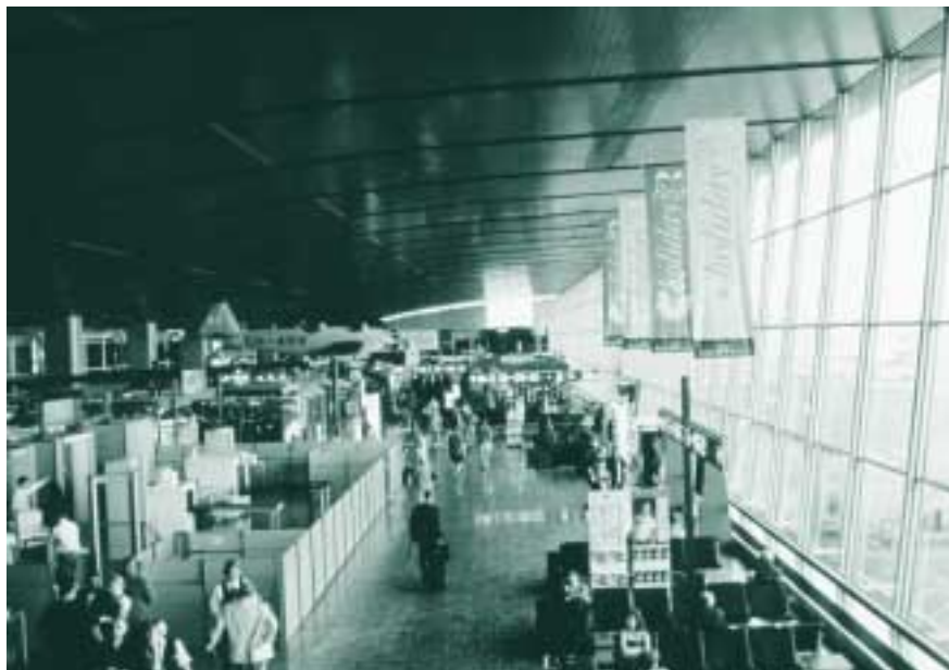
Helsinki-Vantaan lentokenttä valittiin maailman viihtyisimmäksi kentäksi erinomaisine palveluineen.

Kansainvälisestä yhteistyöstä onkin jo usean vuoden ajan muodostunut luonnollinen osa kaupungin toimintaa. Suomen toimiminen Euroopan unionin puheenjohtajana vuoden jälkipuoliskolla luonnollisesti vaikutti, että kokouksia ja konferensseja järjestettiin poikkeuksellisen paljon. Helsingin Finlandia-talo oli pääkokouspaikkana ja varsinainen huip-