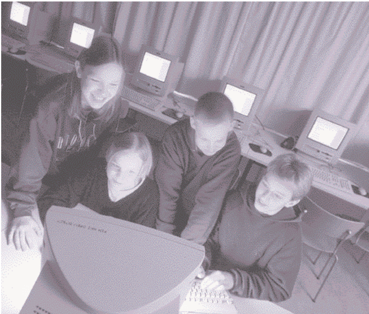
Tietotekniikan opettaminen on Helsingin kouluissa huippuluokkaa.

Uusia, menetettyjen työpaikkojen tilalle tulevia työpaikkoja on kuitenkin syntynyt edellisvuosia nopeammin.