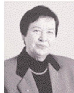
Puheenjohtaja Rakel Hiltunen

Vuoden 1999 talousarvioehdotuksen ja taloussuunnitelmaehdotuksen 1999 – 2001 laatimishojeet (16.3.) Tytär yhteisöjen seurantaraportti (18.5.) Vuoden 2006 talviolympialaisten hakeminen (3.8.) Rakennushankkeiden seurantaraportti (9.11.) Sosiaali- ja terveydenhuollon perustamishankkeet vuosille 1999 – 2002 (7.12.) Suunnittelun yhteiset lähtökohdat vuosiksi 1999 ja 2000 (14.12.) Vuoden 1999 talousarvion noudattamishojeet (21.12.) Kilpailun käytön periaatteiden noudattaminen (21.12.) Tytär yhteisöjen seurantaraportti (21.12.)