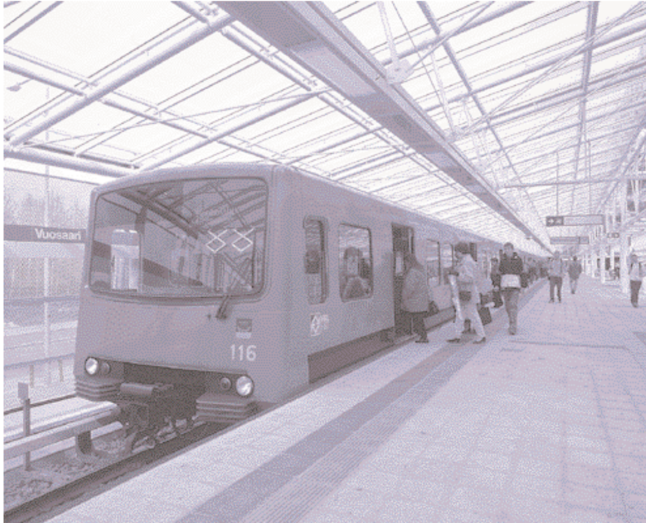
Metro kasvoi itäsuuntaan kolmella asemalla. Sen kokonaispituus on nyt 21 kilometriä.

Ympäristönäkökohtien ja kestävän kehityksen edistäminen eteni kertomusvuoden aikana. Helsingin Sataman ympäristöjärjestelmä saatiin pääosin valmiiksi. Helsingin Vesi julkaisi ympäristöraporttinsa ja hyväksytti ympäristöpolitiikkansa periaatteet ja rakennusvirasto käynnisti uuden ympäristöohjelman tekemisen. Energiansäästöä edistämiseksi hankintakeskus, keskuspesula ja elintarviketukku-