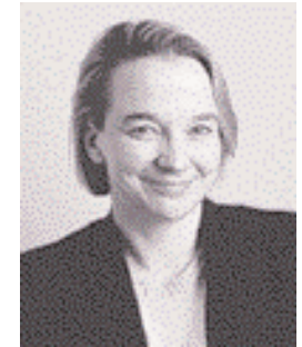
Toinen varapuheenjohtaja Tuija Brax